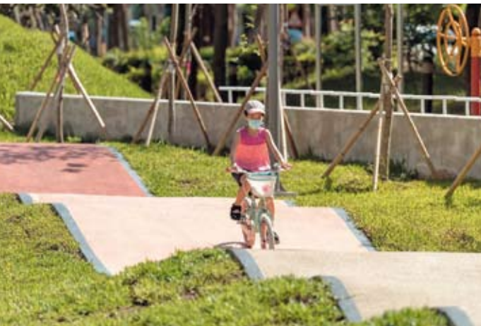
公24興隆公園自然森林遊戲場利用地形變化設計出具有高低起伏並環繞基地的輪具車道

新竹縣政府用心推動特色公園獲得眾多鄉親好評，縣府也喜悅分享來自國際的肯定，竹北市公24興隆公園、芎林鄉公四水霧公園，分別獲得「2022年美國繆思設計大獎(Muse Design Awards)」公園景觀類金、銀獎殊榮，空間設計精彩融入自然地景與主題設施，成果亮眼。