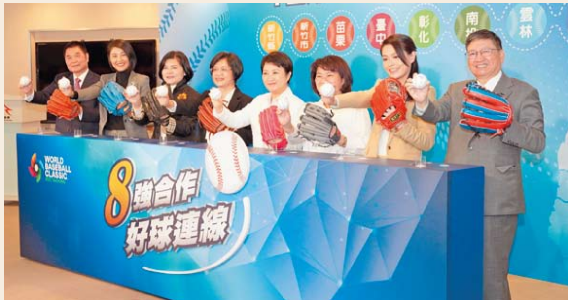
中台灣區域治理平台共有8個縣市參與