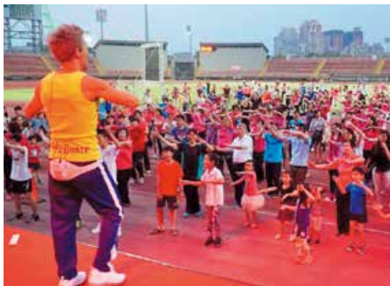
新竹縣體育場是民眾運動的好去處