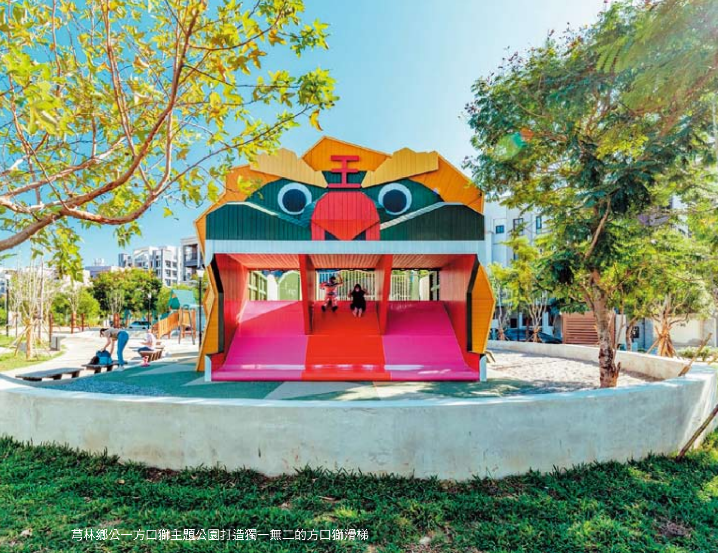
芎林鄉公一方口獅主題公園打造獨一無二的方口獅滑梯

楊文科縣長有感傳統遊具已無法滿足現代人需求，而應讓縣民「自己的公園自己設計」，因此他推動「3年投入2億元打造22座特色公園」政策，規畫設計前也邀集公民參與，廣納民意。