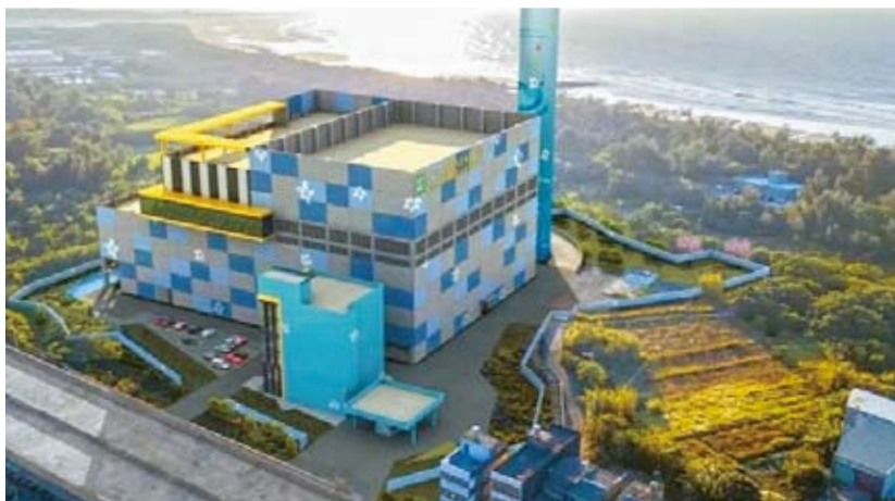
新竹縣垃圾焚化爐模擬示意圖

為對於垃圾處理等民生問題，迫切需要縣市共識解決。新竹縣政府有鑒於採BOO興建的高效能焚化爐，將在113年完工，期待在焚化爐營運之前，新竹市能夠協助焚燒新竹縣垃圾。