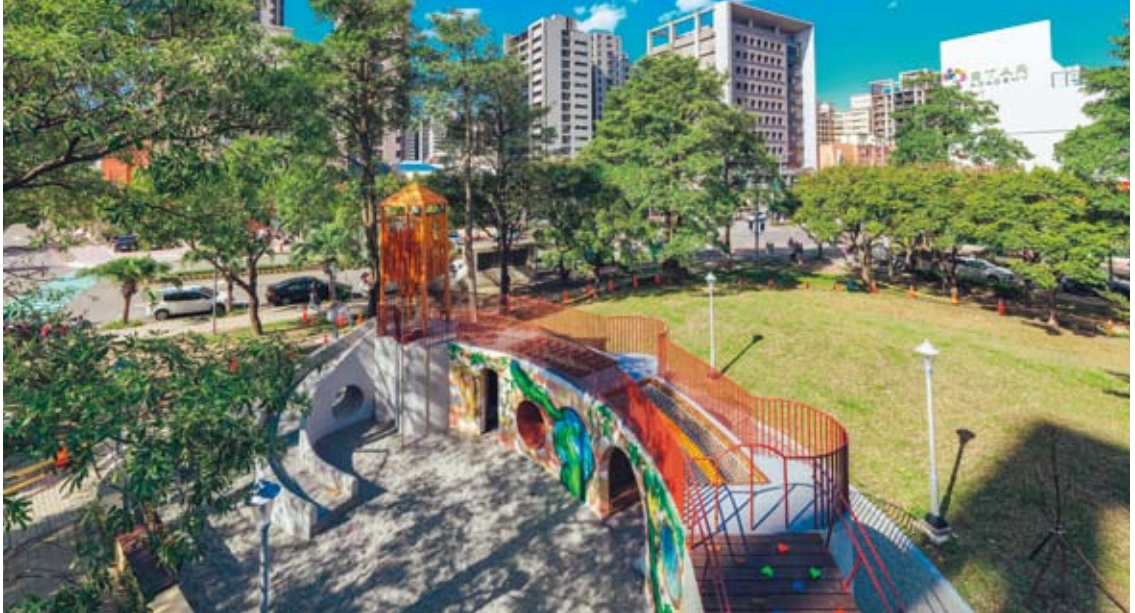
特色公園旁營造綠地空間，讓孩子可以自在遊戲

肉、小肌肉的發展，同時也打造讓小小孩可使用的設施，如原木樹木樁、較低矮的攀爬設施、滑梯、躲藏空間等，搭配人工草及木屑鋪面，不僅讓孩子能安全遊戲，整體景觀也更加協調。