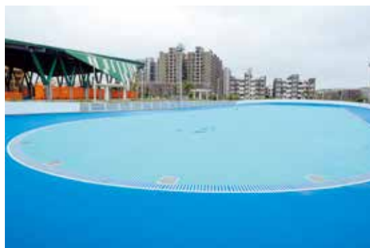
湖口王爺壟運動公園的國際標準競速滑輪溜冰場

全中運在竹縣今年設有3大重點場館，分別是新竹縣體育場、新竹縣體育館及王爺壟運動公園，全都投入經費新建或翻新整建，要迎接今年新竹縣規模最大的全國綜合性運動賽會，同時新竹縣各校也積極配合，利用學校場館舉辦賽事，不僅是提供符合國際賽事合格、完善的場地，更要讓來自全國的2萬名選手有最優質的競賽環境與體驗，在賽場上盡情發揮實力。