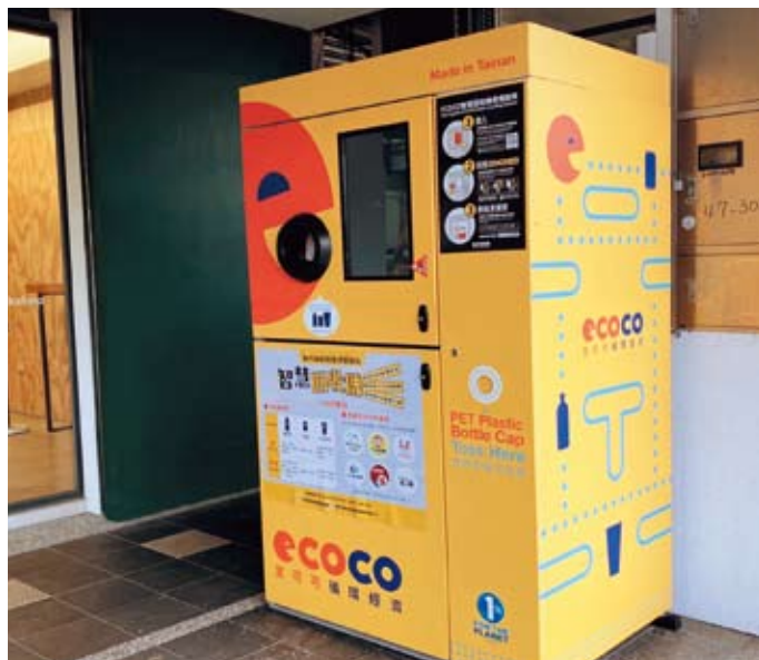
民眾可到湖口鄉建置的「智慧回收機」投遞瓶罐集點

新竹縣政府環境保護局為推廣環保意識，111年試辦推出「智慧回收機」獲回響，今年在反應最熱烈的湖口鄉持續推出智慧回收機，即日起至12月14日每天早上9時30分至晚間9時30分提供服務，歡迎鄉親資源回收做環保，還可集點兌換購物金，一舉數得。