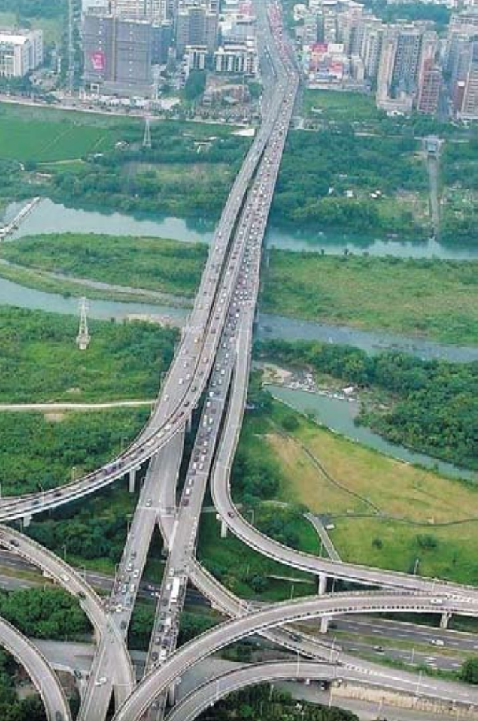
新竹縣十大交通建設之一為「經國橋道路改善計畫」