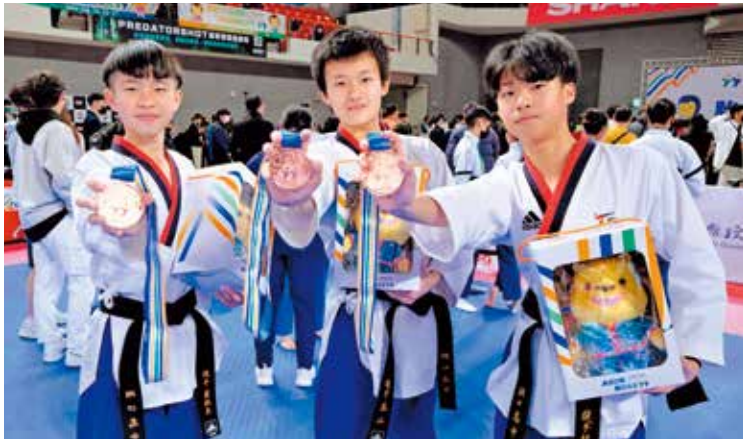
全中運跆拳道品勢項目在新竹縣體育館進行，地主隊湖口高中抱回3面獎項