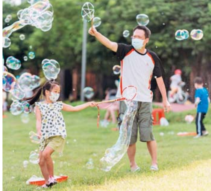
特色公園已經成為孩子與家長的快樂天堂

來到同樣在去年開放的芎林鄉公四水霧自然遊戲場，公園內也完整保留既有樹木群，打造順暢、分齡遊戲的遊戲場空間，滑梯、攀繩、鞦韆、沙坑區等遊戲設施一應俱全。特別的是設置全台唯一的水霧設施，讓夏日在