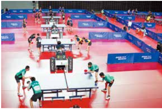
全中運桌球項目各縣市好手比拚