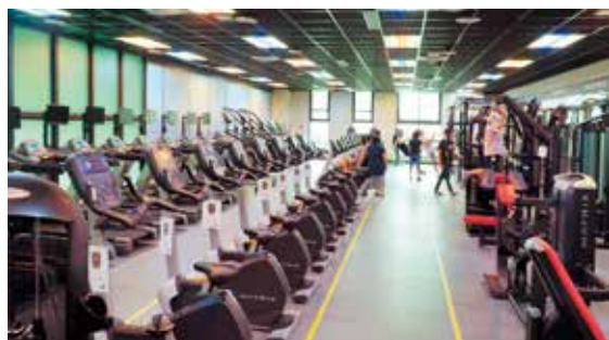
竹北國民運動中心設施豐富

新竹縣政府大力提升縣內運動風氣，除了積極興建體育場館、運動公園等硬體建設打造優良場地，也祭出培育人才等政策，包括支持學校單項體育經費、提高選手獎勵金及營養金等，讓選手能無後顧之憂，努力突破自我、發揮實力，征戰更多運動賽事發光發熱。