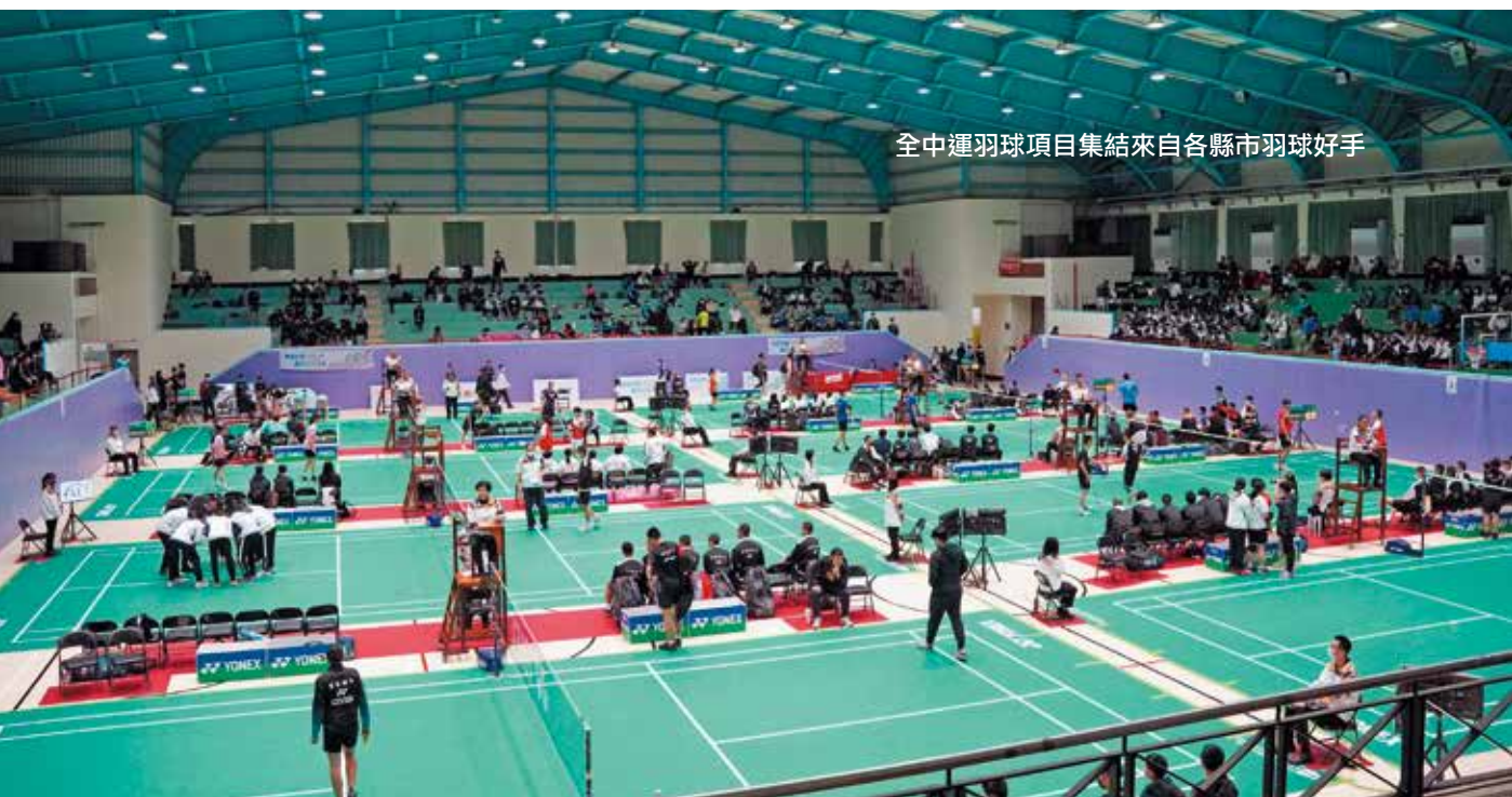
全中運羽球項目集結來自各縣市羽球好手

新竹縣內各學校也積極協辦全中運賽事，如明新科技大學即提供體育館作為羽球賽事場地，面積上千平方公尺的室內體育館，不僅有8面羽球場，還可容納2千名