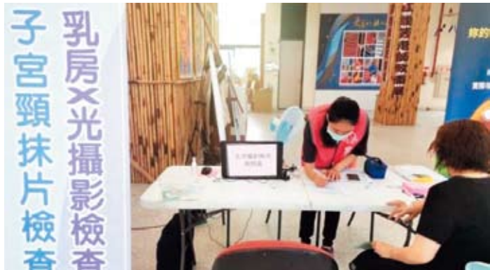
婦女應定期篩檢子宮頸抹片與乳房X光篩檢