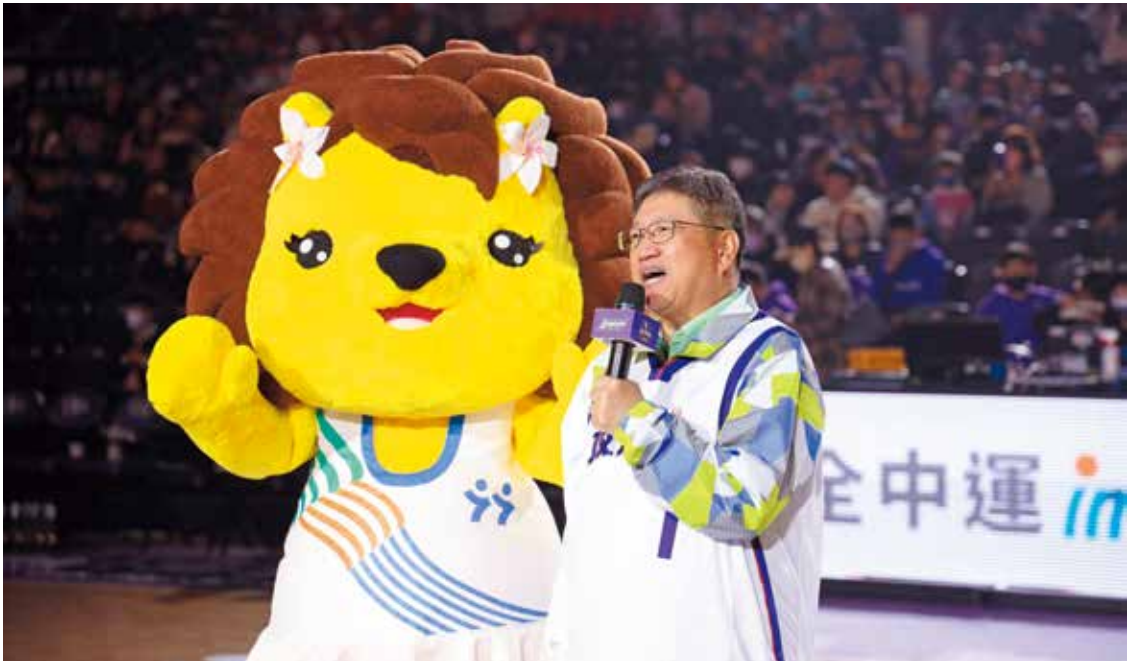
楊文科縣長相當支持運動，讓新竹縣邁向運動大縣