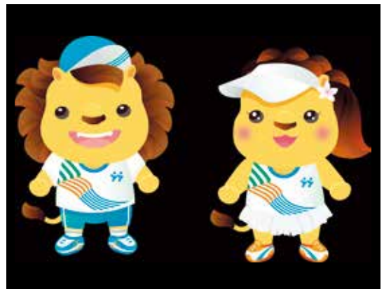
新竹縣的全中運以「皮皮獅」與「阿茶妹」為吉祥物，相當可愛

去年新竹縣也投入近6,000萬元經費，改善主要7校的學校體育館或活動中心等場館，包含湖口高中、新埔國中、竹北國中、新湖國中、自強國中、新豐國小、竹北國小，讓老舊場館設施煥然一新，不僅符合競賽場館的標準規範，提供安全良好且符合規範競賽場地空間，還能夠為學校留下優質場地。