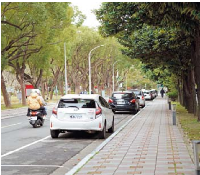
路邊停車繳費管道多元，可節省時間

路邊停車繳費更便利！新竹縣路邊停車費除了可到24小時營運的超商繳納、透過金融機構代繳，縣府今年也擴大第三方支付業者繳交停車費服務，從7家一口氣增加至13家，不僅選擇管道多元，隨時隨地都能完成繳費。