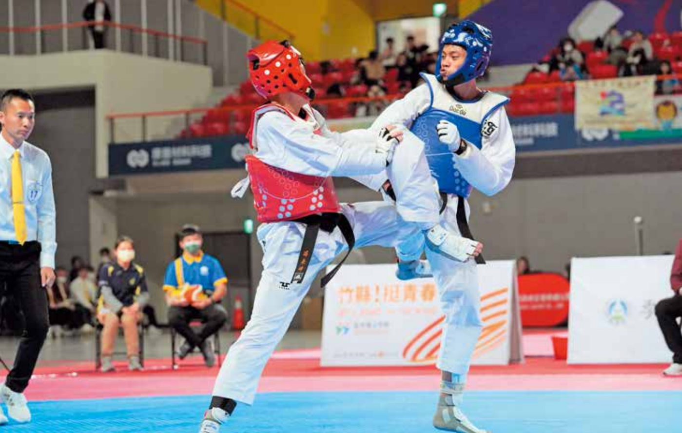
全中運在新竹縣體育館進行跆拳道項目比賽，場場賽事精彩