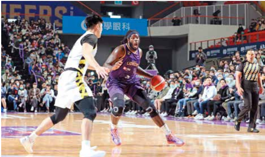
街口攻城獅主場就在新竹縣體育館，成功帶動竹縣籃球風氣

新竹縣作為體育大縣，楊文科縣長相當重視體育發展，為讓選手能夠專注訓練、減輕經濟負擔，111年正式發布「新竹縣績優運動潛力選手培訓補助金發給要點」，發放最高每人每月1萬2千元的培訓補助金，希望能藉此挖掘、培訓，以及照顧新竹縣在地的績優運動選手。