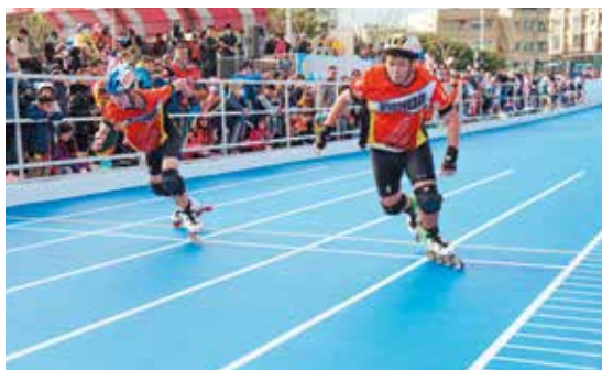
新竹縣積極打造運動場地與館舍，近年大力推廣的滑輪溜冰運動展現速度與技巧