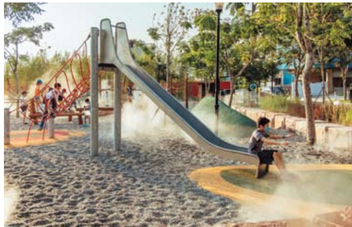
芎林鄉公四水霧公園拿到「2022年美國繆思設計大獎」公園景觀獎項肯定