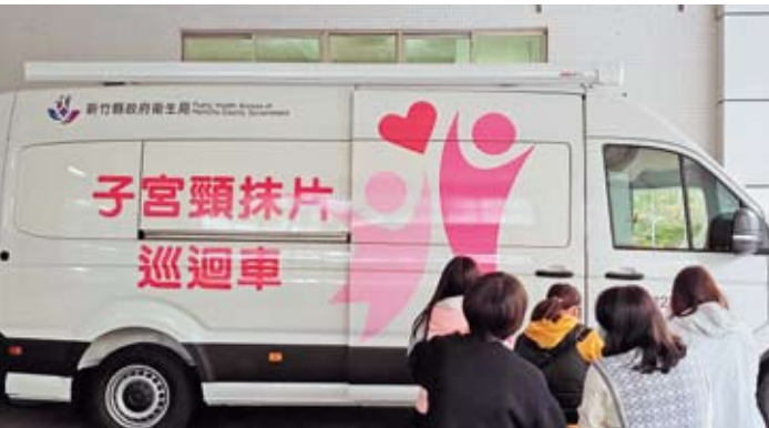
新竹縣政府衛生局今年推出婦女癌症篩檢抽獎活動，鼓勵婦女定期篩檢