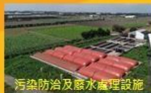
污染防治及廢水處理設施