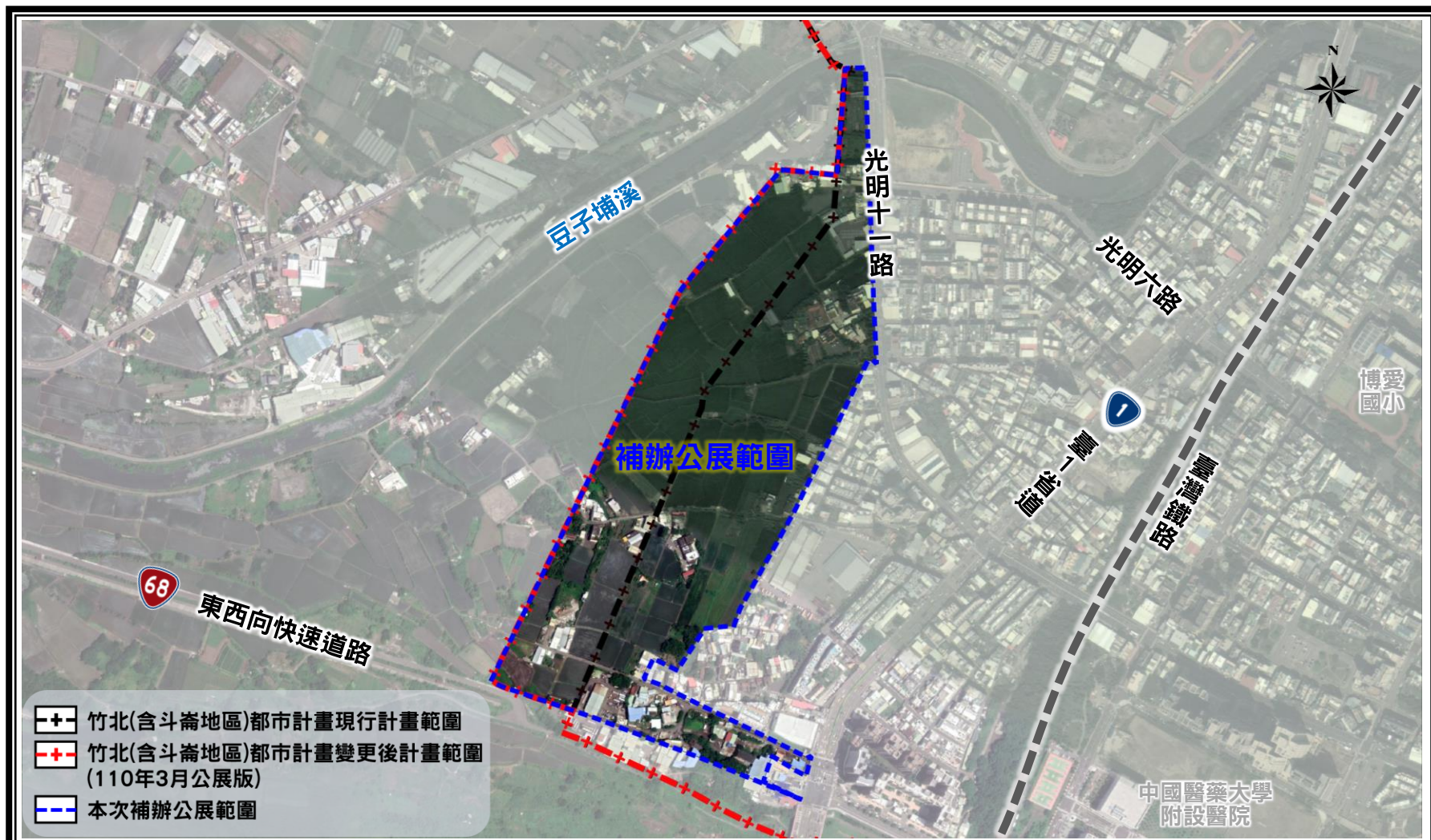
圖2 本次補辦公展範圍示意圖