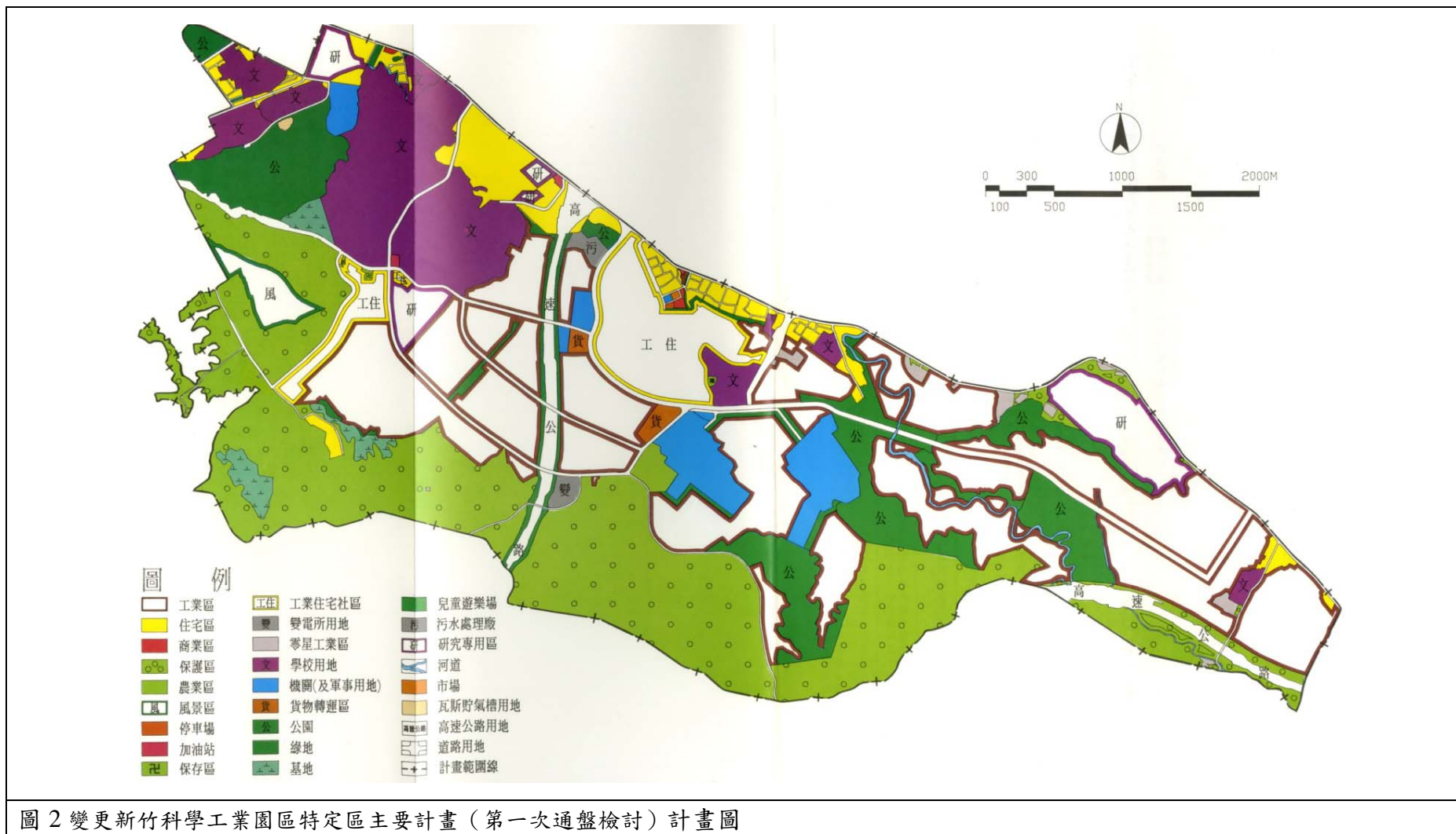
圖 2 變更新竹科學工業園區特定區主要計畫（第一次通盤檢討）計畫圖