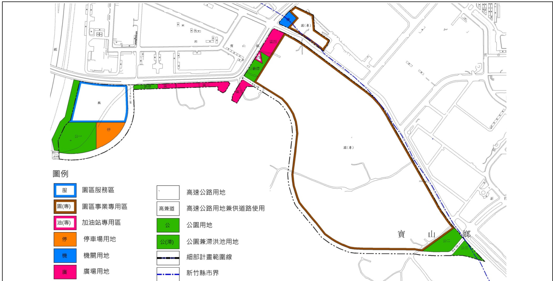
圖 3 變更新竹科學工業園區特定區（新竹縣轄部份）（園區三路、五路地區）細部計畫示意圖

資料來源：變更新竹科學工業園區特定區（新竹縣轄部份）（園區三路、五路地區）細部計畫書（97年6月）