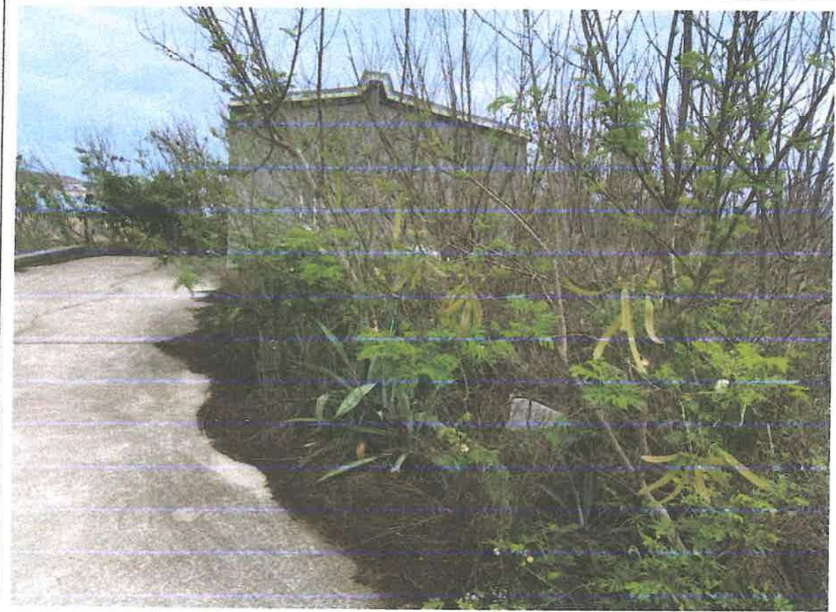
馬公市井垵西段地號 886 土地無主孤墳現場照片