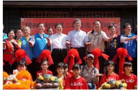
新竹縣定古蹟關西分駐所第二期修復工程竣工剪綵儀式