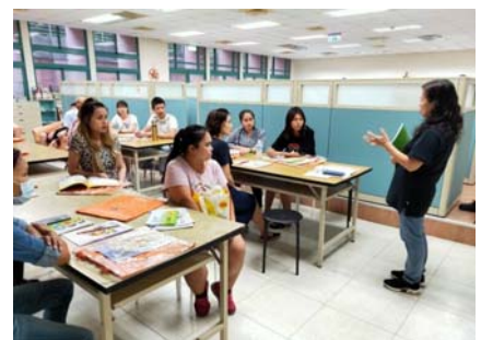
109.6.18開辦成人基本教育研習班