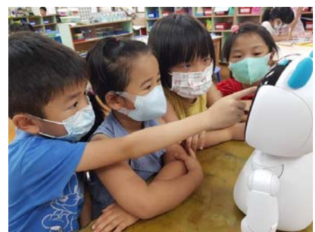
藉由機器人「凱比」啟發孩童學習興趣