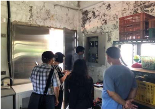
中山國小電力盤點