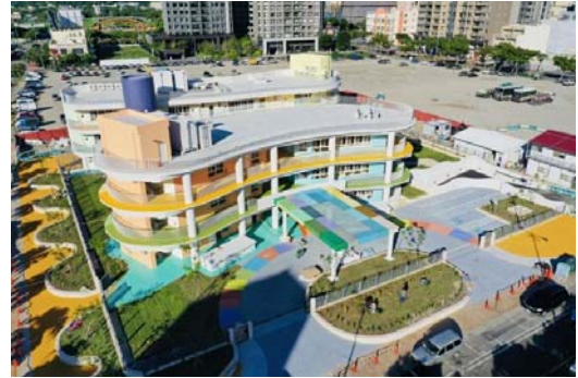
嘉豐國小(文小一)非營利幼兒園