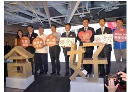
109.7.31身心障礙福利服務中心開幕