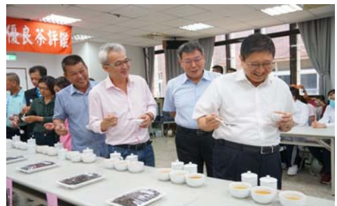
109. 7. 14東方美人茶(膨風茶)優良茶比賽