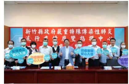
109.5.26頒發首批「安心旅宿」標章