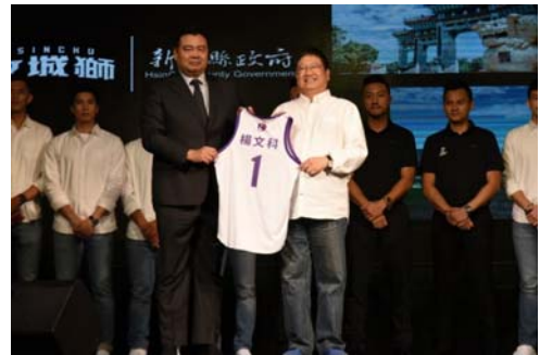
攻城獅職業籃球隊與本府合作備忘錄簽約