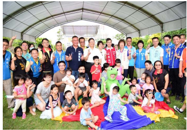
109.9.19公民參與一齊打造夢想公園 興隆公園野餐音樂市集