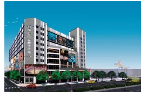
竹北市自強七街立體停車場BOT案