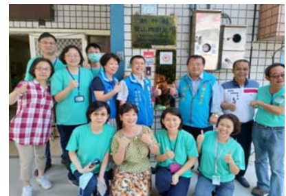
109.9.18 寶山鄉衛生所巷弄長照站揭牌