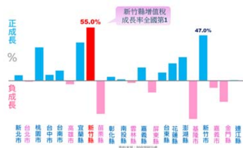
新竹縣增值稅稅收成長率全國第一