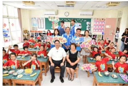
109.7.7縣長赴竹北市興隆國小視察有機營養午餐執行成效