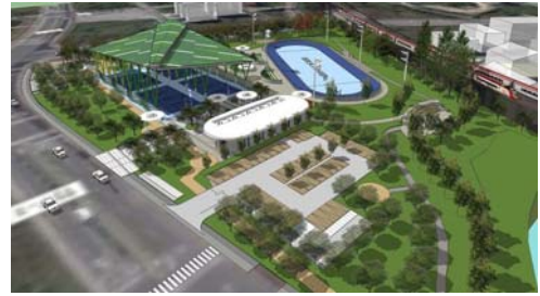
湖口王爺壟運動公園空拍模擬圖