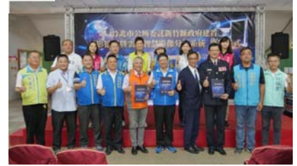
109.6.18錄影監視暨雲端智慧影像分析系統簽約儀式