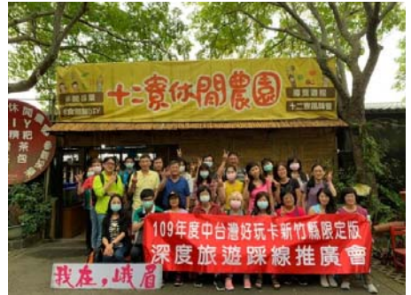
109.9.12於峨眉鄉十二寮舉辦「109年度中台灣好玩卡新竹縣限定版-深度旅遊踩線推廣會」