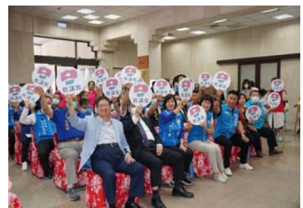
109.9.29「你講客、佢講客、大家共下來講客」誓師大會