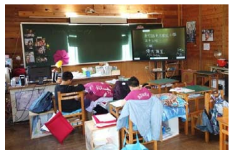
智慧校園「數位大黑板」大型觸控顯示器