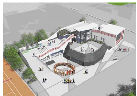
新竹縣原住民族教育推廣中心示意圖

109年4月20日獲原住民族委員會補助3,620萬元，自籌1,580萬元，總計5,200萬元，將竹東動漫園區轉型為原住民產業展銷中心，預計110年2月招商，3月底揭幕