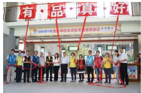
安興國小「109年新竹縣推動學校品德教育暨環境營造成果發表」

於109年10月6、7日針對校長、教師辦理2天1夜「109年度品德教育深耕探索種子教師工作坊活動」，共15所品德種子學校、60所學校校長共同參加