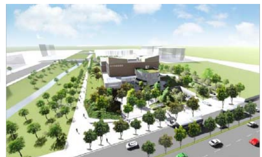
新竹縣立總圖書館空拍模擬圖