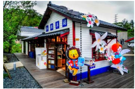
本縣尖石鄉及橫山鄉獲山城小鎮殊榮