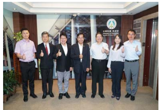
109.7.29向教育部爭取竹北設校經費