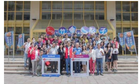
「竹夢 Young 點子競賽」8組團隊入圍