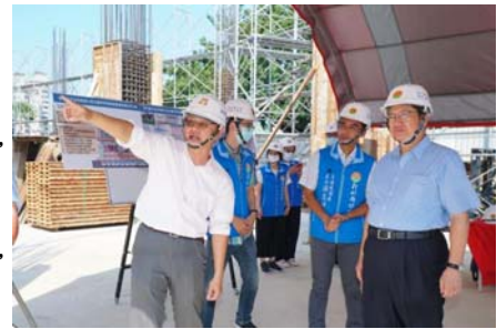
109. 9. 2會勘竹北自強七街立體停車場BOT案