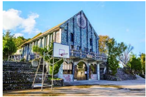
斯馬庫斯、鎮西堡土地變更計畫案

109年編列600萬元，以羅山部落為試辦區域，將73年以前興建的房屋合法化共19戶已於109年10月取得合法房屋證明函文 房屋合法化將逐年延伸到其它部落，預期有近千戶受惠