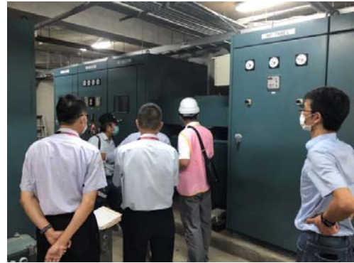
博愛國中電力盤點