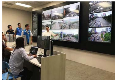
新竹縣交通控制中心智慧交通控制運作情形