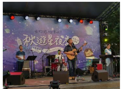
109.10.2 秋遊星夜季-首場「浪漫山林音樂會」於橫山文物館登場