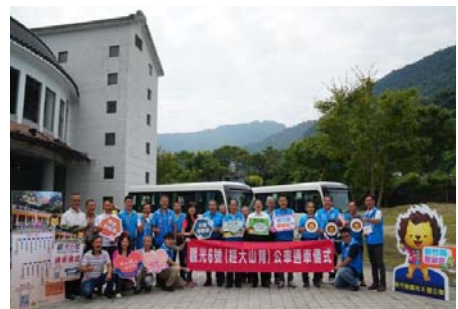
109.9.5新竹縣觀光6號公車正式通車