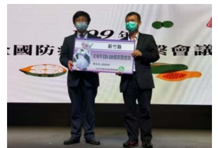
109.9.2本縣榮獲衛福部COVID-19防疫貢獻個案關懷獎等2大獎項