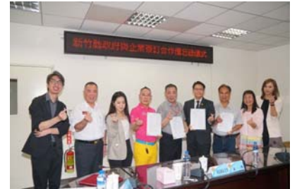
109.6.5簽署企業救災合作備忘錄