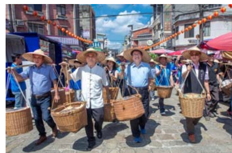
「2020全國義民祭在新竹縣」-「義民爺禮讚-挑擔奉飯義民情」