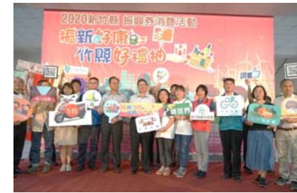
109.8.26「振興好康 竹縣抽好禮」記者會