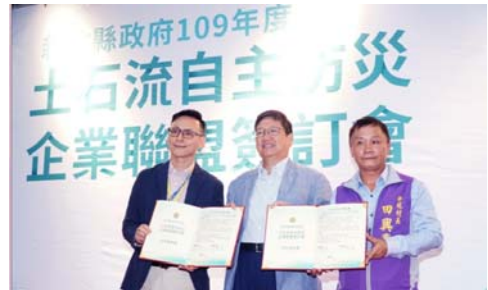
109. 10. 13土石流自主防災企業聯盟簽訂會