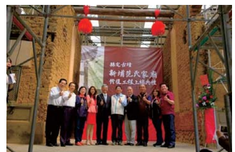
107/3/26 范氏家廟上梁典禮