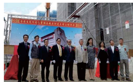
106/10/19 台康生技世界級蛋白質工廠上梁典禮