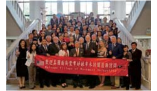
107/3/28美國衛斯蒙市長率隊參訪本縣

本府與美國衛斯蒙市於106年8月15日締結姊妹市盟約與教育備忘錄。美國衛斯蒙市市長 甘朗德 率團於107年3月28日蒞臨本府，與本縣各產業界代表互相交流，讓兩座城市得以教育為起點，進行產業文化交流