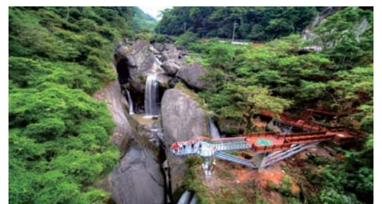
那羅溪畔環境景觀工程