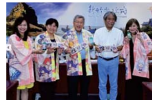
107/4/12日本有馬溫泉協會訪縣進行文化交流

本縣於2014年與日本有馬溫泉觀光協會簽訂合作備忘錄，107年4月12日 金井啟修 會長率團訪縣，參觀內灣風景區並與縣內溫泉業者交流座談，希望透過本次活動廣納在地特色元素，再創文化風潮