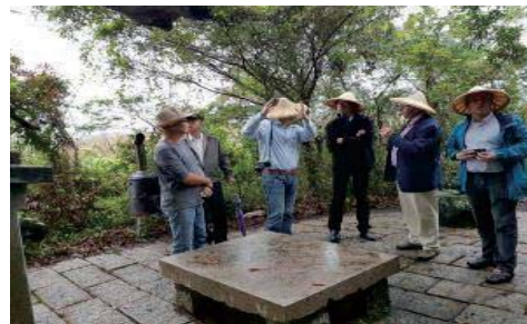
106/11/22德國農村競賽聯邦級評審訪視南埔社區

為促進再生能源推動發展，建立產業雙贏，積極輔導全縣畜牧場設置太陽能板，目前已核准13家畜牧場設置太陽能板