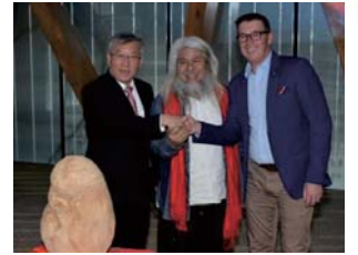
107/3/24澳洲伊普斯威奇市長率隊參訪本縣

本府於1994年起與伊普斯威奇市締結姐妹市，並於2015年簽署合作備忘錄。為雙方提供良好的合作契機。107年3月24日澳洲伊普斯威奇市長 安德魯·安東尼奧利 率團參訪本縣，期望雙方的合作關係能夠繼續蓬勃發展