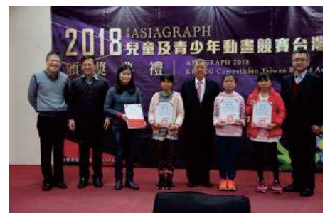
日本ASIAGRAPH 2018兒童及青少年動畫競賽台灣選拔賽頒獎