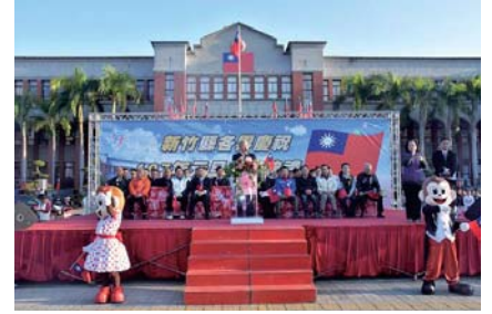
107/1/1 元旦路跑暨健走活動