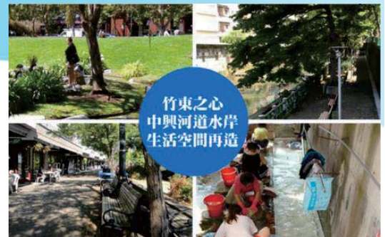
中興河道水岸生活空間再造工程計畫