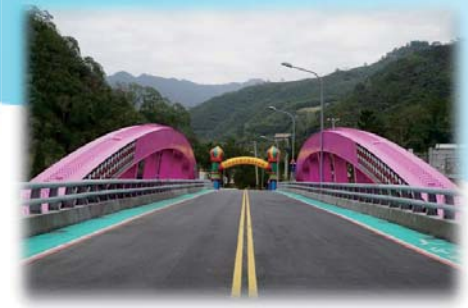
尖石鄉新樂大橋通車