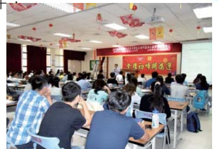
勞工安全衛生教育訓練