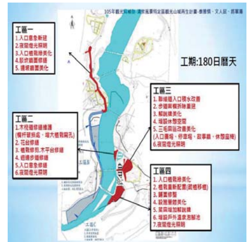
清泉風景特定區觀光山城再生計畫