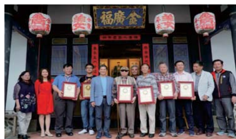
107/4/1金廣福公館、忠恕堂開館典禮