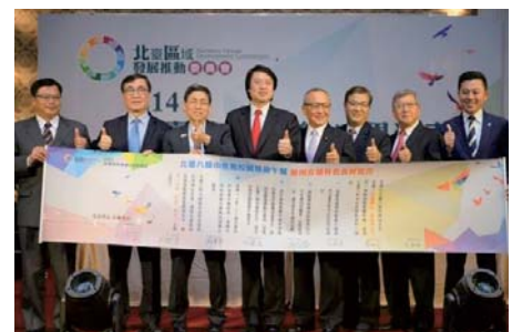
107/3/29北臺區域發展推動委員會學生午餐在地食材合作簽署