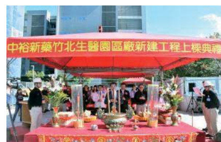
106/11/9 中裕新藥竹北生醫園區廠新建工程上梁典禮