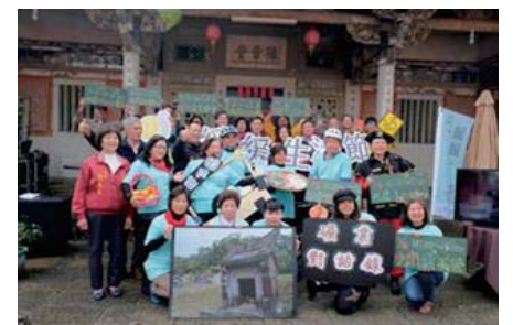
107/1/17緩緩生活節記者會