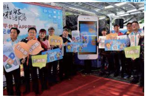
106/12/26「雲端行銷導購平台暨APP 啟用儀式」記者會