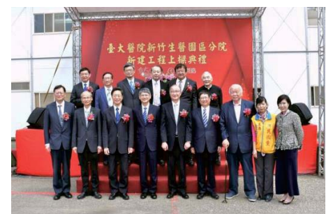
107/3/16 新竹生醫園區醫院新建工程上梁典禮