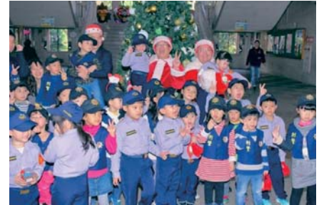
106/12/22 一日小小警察體驗營