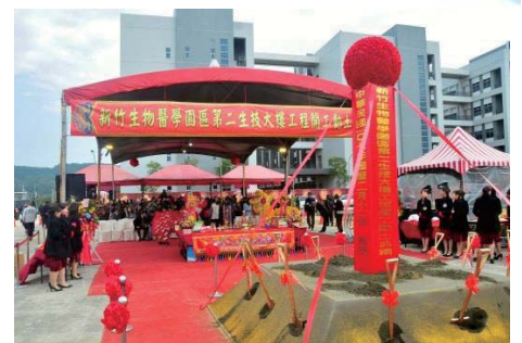
107/2/20 新竹生醫園區第二生技大樓開工動土典禮