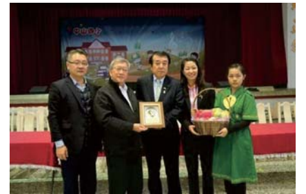
107/1/19中日少棒國際交流賽開幕