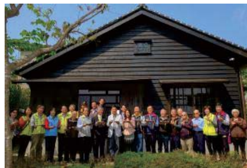
107/3/17 關西分駐所所長宿舍開放參觀