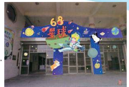
新竹縣動漫教育中心「68號星球」