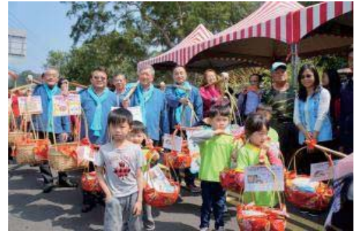
107/3/2寶山鄉打中午文化季

2017年包括日本高知舞蹈團活動計有國內、外團隊20團參與演出，活動主軸以追尋客家傳統藝術精神為核心，透過結合校園及社區力量，讓原始花鼓藝陣的生命力量得以展現