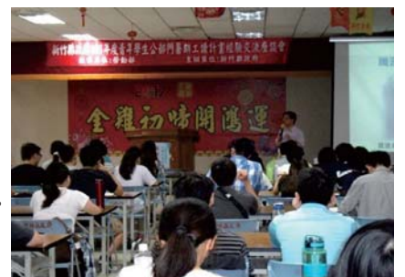
106年度青年學生公部門暑期工讀計畫經驗交流座談會