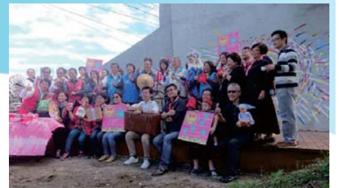
106/12/10 新竹縣動漫藝術節

於106年12月10日舉辦，搭配「創意時尚週聯合展覽」時程，並結合「竹東動漫園區」與「竹東文創藝術村」，以動漫元素與文創藝術的主題進行