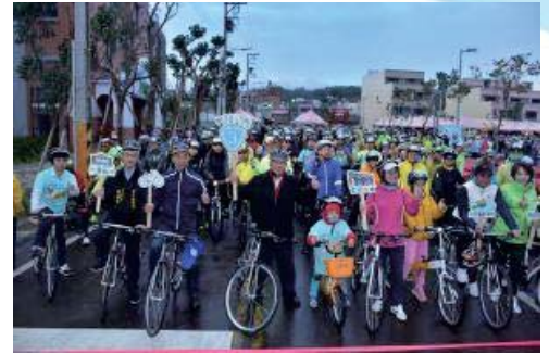
106/12/2浪漫台三線 單車遊竹縣

於106年12月2日浪漫開騎，起終點會場選在新埔鎮藝文廣場，從起點開始環繞新埔與關西地區，用騎乘29公里的單車旅行方式體驗本縣好山好水