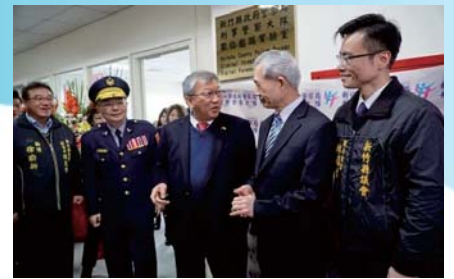
107/2/7 數位鑑識實驗室揭牌