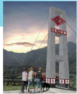
清泉一號吊橋整建示意圖