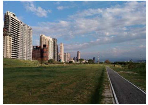
已完成頭前溪高灘地沿岸綠化計畫