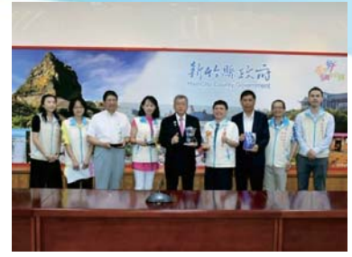
榮獲「106年地方衛生機關保健業務考評」5大獎項