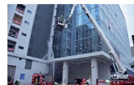
107/1/19 台元科技園區廠區火警事故演練