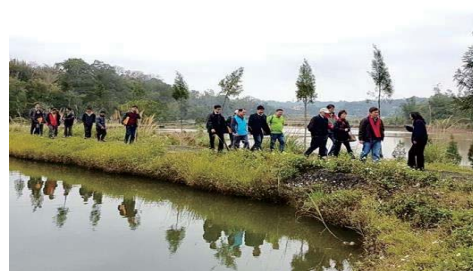
107/2/22 峨眉鄉無負擔社區成為農村再生社區