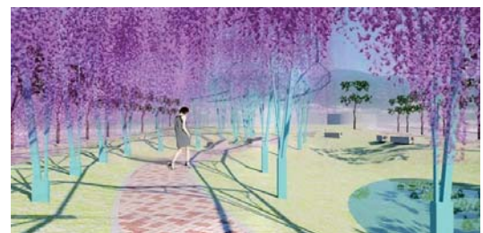
竹東台泥舊廠區公園造型客家花廊示意圖