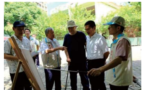
106/8/2 客家委員會李主委永得訪視本縣