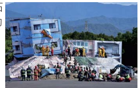
107/3/30 民安4號演練獲行政院讚賞