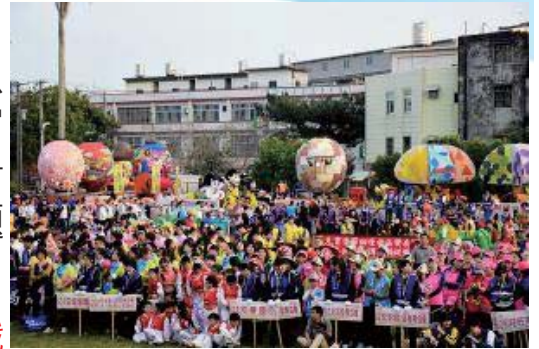
107/3/3會移動的花燈在新埔不夜城