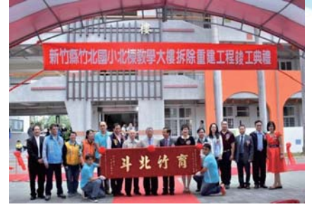
106/11/11竹北國小繁星樓校慶慶祝大會暨校舍竣工典禮