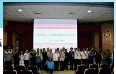
107/4/16「尖峰時刻」警政座談會