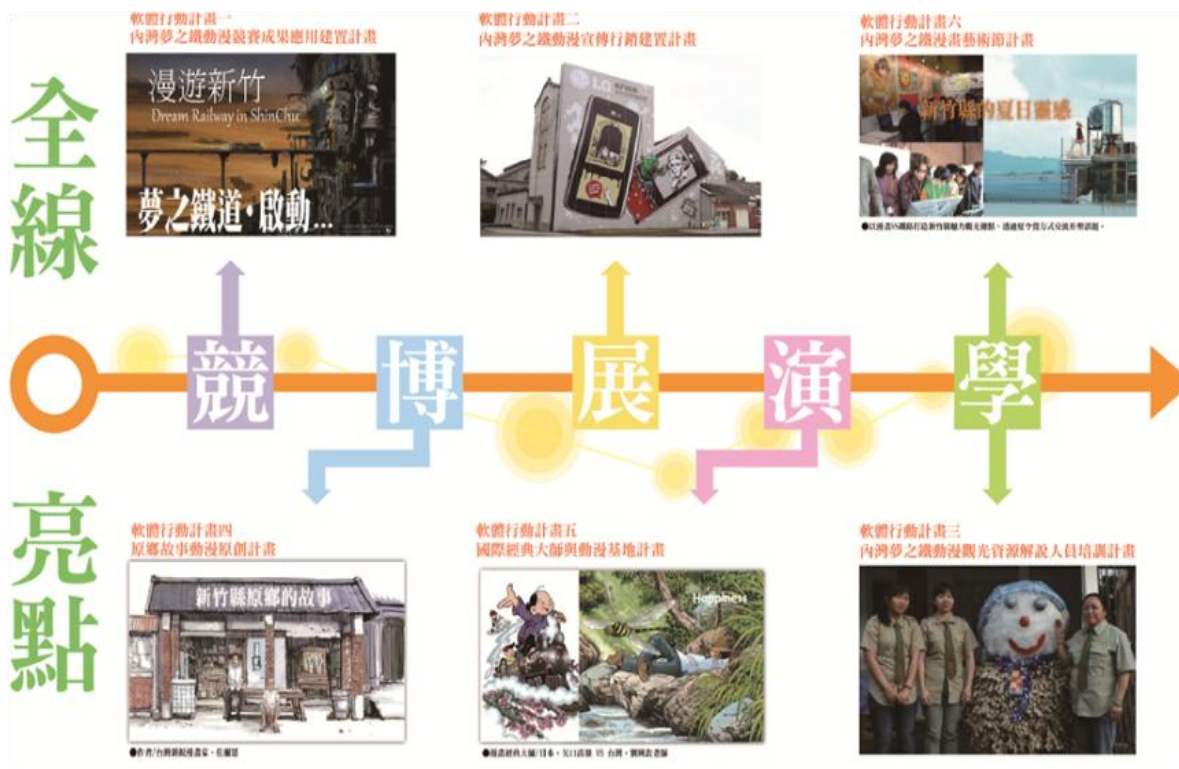
軟體行動構想內容圖

以軟體計畫串連整體推動計畫，經由時間鏈堆砌及營造整體氛圍，成功型塑漫畫鐵道的全球魅力及品牌特色。