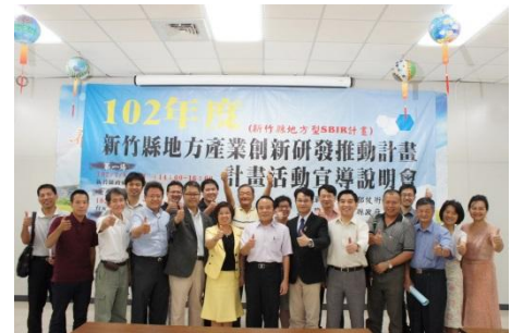
102/7/8 SBIR 巡迴說明會

新竹縣首屆地方型 SBIR，於今年 6 月起辦理 3 場次說明會及 1 場計畫書撰寫課程，於 7 月開始受理申請，每家企業最高可申請 100 萬元補助，預計將有 40 家中小企業受惠。