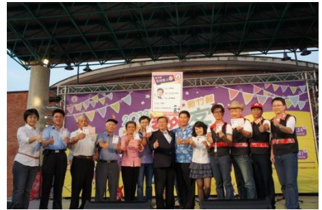
102/9/10 第二屆新竹縣街頭藝人授證

第二屆新竹縣街頭藝人甄選計有 69 組通過考驗，加上第一屆 53 組及首度開放外縣市街頭藝人換證(開放以 3 張外縣市街頭藝人證換取本縣證照)，共有百餘組街頭藝人取得本縣街頭藝人表演證照，讓新竹縣街頭藝術表演將更具魅力、更有看頭。