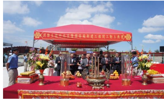
102/7/29 P3 等級蛋白質藥工廠開工儀式

由潤泰集團與浩鼎生技公司合資 10 億新台幣成立潤雅生技股份有限公司，102 年 7 月 29 日舉辦開工動土典禮，興建規劃生醫園區內達全球最高階的「P3 等級蛋白質藥工廠」。