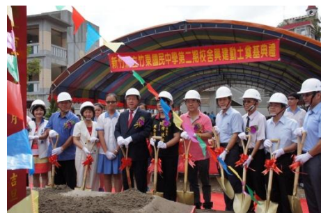
102/10/9 竹東國中二期校舍動土典禮

6) 竹東國中於 102 年 7 月 4 日決標，已完成建照與五大管線申請，並於 102 年 10 月 9 日辦理校舍動土典禮，預計 103 年 9 月完工。