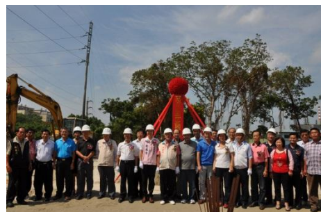
102/10/26 竹北 30 米外環道動工