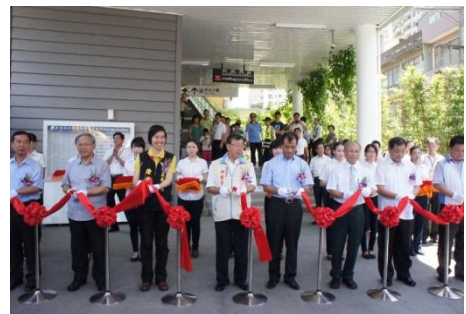
102/7/17 邱縣長參加台鐵竹北站跨站站房正式啟用儀式