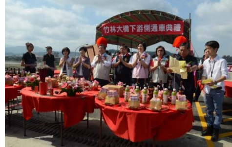
102/10/10 竹林大橋下游側通車典禮