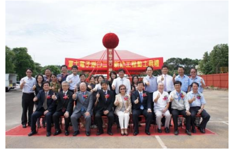
102/6/25 台灣富士電子材料二廠動土

18)英國海名斯集團：於新竹工業區（湖口）設置研發中心，預估新增 1,000 個就業機會，年產值 20 億元。