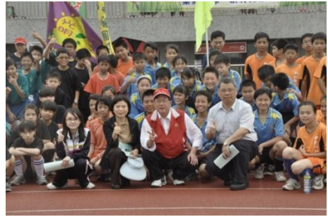
102/5/9 樂樂足球錦標賽開賽

102 年度「國民小學樂樂足球錦標賽」於 102 年 5 月 9 日在本縣第二運動場舉行，樂樂足球推廣建立學生良好運動習慣，促進國小學童身體健康、增強體適能，同時也可培養學生認知世界性主流運動，倡導少年足球運動，廣植足球活動參與人口，為推廣基層足球運動奠定扎根工作。