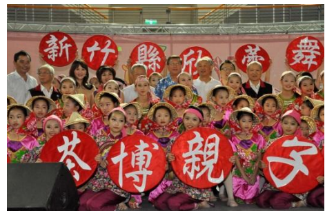
102/7/7 茶博親子嘉年華會

為推廣本縣茶文化與茶產業，本府獲「地方產業基金」補助 1,500 萬元，為擴大推廣及參與於 102 年 7 月 7 日結合科學教育月活動共同舉辦「2013 茶博親子嘉年華會」，首創千人製茶 DIY 親手做及各項闖關活動，吸引親子參與體驗製茶樂趣。