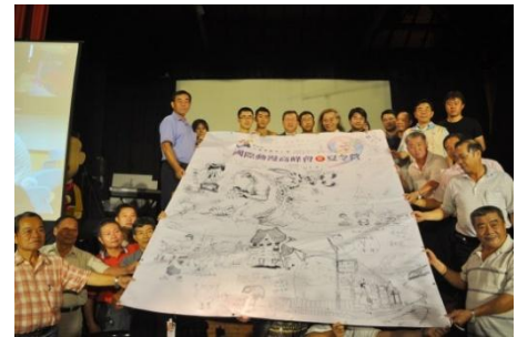
102/8/23 夏令營活動創作動漫作品致贈本府

「2013 國際動漫高峰會暨夏令營」，於102年8月18日起展開為期5天的夏令營活動，設國際專業組、國內專班與新竹縣專班三個組別，邀請國際級的動漫大師及國內知名漫畫家擔任講師並留下創作，是台灣漫畫史上最盛大的一次國際動漫交流高峰盛宴。