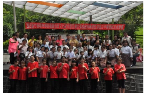
102/7/6 鄧雨賢音樂文化園區舞台落成啟用