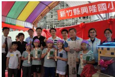
102/8/29 興隆國小校舍啟用典禮

竹北地區人口發展快速，為因應竹北縣治二期及高鐵等區域內學童入學需求， 竹北興隆國小、東興國小校舍於 101 年 7 月工程決標，為了讓師生家長對學習空間可以安心放心，2 所新學校於今年 8 月如期完成一期工程，8 月 29 日分別於兩校舉辦啟用儀式，102 學年度上學期(8 月)師生如期進入新校舍上課，二期工程（周邊設施及綠美化）預計 103 年 1 月完成。