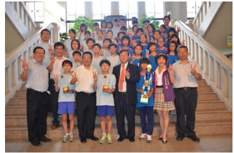
102/5/28 新湖國小拔河隊將榮耀獻給邱縣長

新湖國小拔河隊參加教育部體育署 102 年度全國各級學校拔河比賽，榮獲國小班隊男生組第一名、國小班隊女生組第三名佳績。