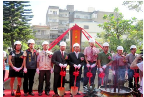
100/9/26 山崎國小新建校舍動土典禮

1) 山崎國小老舊校舍整建工程已於 102 年 4 月 3 日竣工，預定 102 年 11 月 21 日辦理落成典禮。