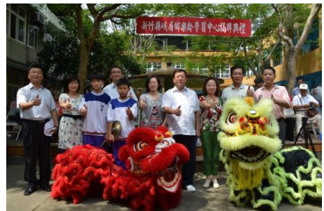
102/9/17 第 9 座樂齡學習中心在峨眉揭幕

樂齡學習中心主要服務對象為縣內的長輩，以一鄉鎮一樂齡學習中心為目標，目前已有 9 所學習中心提供老人快樂學習的課程與環境；以多元課程深耕