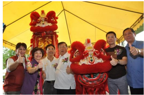
102/6/13 高鐵橋下道路工程動工