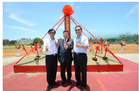
102/6/19 全家食品新豐廠開工動土