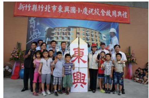
102/8/29 東興國小校舍啟用典禮