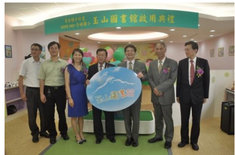
102/9/25 員嶼國小玉山圖書館開幕儀式

玉山志工基金會推動社會公益，繼捐助湖口鄉和興國小(100年3月)、新埔鎮寶石國小(101年4月)後，於本縣竹東鎮員嶼國小成立第三座「玉山銀行黃金種子圖書館」，不僅為學童提供舒適溫馨的閱讀環境，也是社區資源共享的假日圖書館。