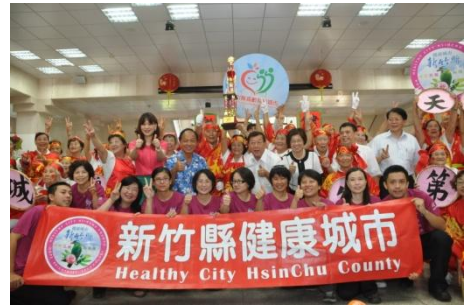
102/9/9 天天開心隊 獲北區第2名

配合「活躍老化、在地老化」政策的高齡者健康促進活動，藉由專屬長輩展現健康活力的舞台，激發不老風潮，至今已連續舉辦3年，深受民眾支持與歡迎。