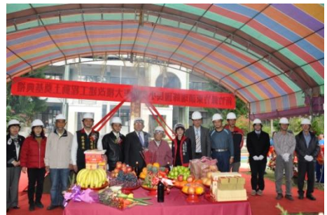
101/1/12 瑞峰國小新建校舍動土典禮

3) 瑞峰國小老舊校舍整建業已於 102 年 1 月 25 日竣工，並完成結算驗收，刻正進行公共藝術工程，預定 102 年 11 月 16 日辦理落成典禮。