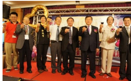
102/7/25 邱縣長促成祥儀企業與縣內四所科大策略聯盟

促成祥儀企業與新竹區四所科技大學結盟：新竹縣產(祥儀公司)官(新竹縣政府)學(大華科大、中華科大、中國科大、明新科大)策略聯盟，共同培育科技菁英的人才。