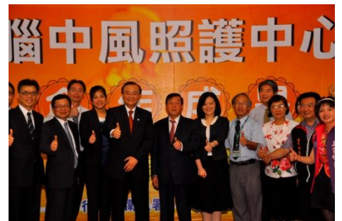
102/5/21 新光醫院加入急重症照顧醫療服務行列

衛生署「醫學中心支援醫療資源不足地區計畫」，指定新光醫院輔導仁慈醫院，成立新竹縣第一家腦中風照護中心，由新光神經專科醫師，提供 24 小時的緊急醫療服務，讓腦中風病患救援服務更即時、更有保障。