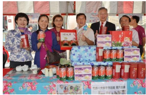
102/9/7 第二屆十大伴手禮展售會

秋節前（102年9月7日星期六）在新竹巨城購物中心一樓地球廣場進行頒獎發表會暨假日展售會，假日購物人潮眾多，正是提供鄉親朋友選購中秋佳節禮品的絕佳時機，展售會當天並推出限時優惠價、一元競標、滿額贈等好康，吸引民眾搶購，活動現場交易熱絡。