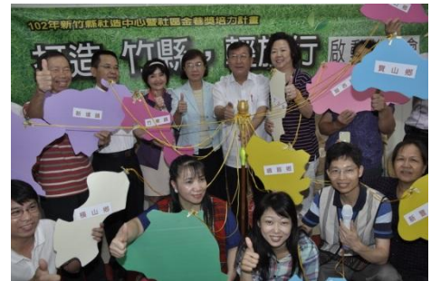
102/6/11 啟動黃金小旅行說明會

打造竹縣輕旅行發現社區之美，結合歷年社區總體營造成果與能量，將社區之美轉化為文化休閒產業啟動社區營造新的扉頁，9 月 24 日推出 14 條黃金路線試辦「黃金小旅行」，開放報名反應熱烈！14 條黃金路線踏訪社區與主題為：