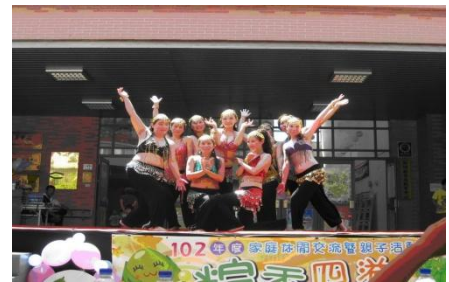
102/6/8 新住民家庭服務中心慶祝端午節

有別於傳統的新住民表演活動，「築親庭志工團隊」由一群新住民志工團隊組成，於端午節創新演出跳脫傳統的表演獲得好評；結合「越南/印尼粽子品嚐」、「夫妻/婆媳包粽比賽」、「親子香包DIY」等節目，邀請新住民家庭參與，共同歡度端午節慶。