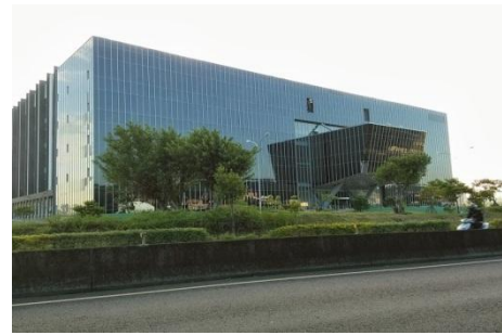
生技與產品研發中心建築外觀

「生醫科技與產品研發中心」與「產業及育成中心」共同建築，建築主體已完工，預計103年啟用，依經濟部中小企業處規劃的「產業及育成中心」、國家實驗研究院的國家實驗動物中心與儀器科技研究中心等單位將陸續進駐。此外，生技整合育成中心(Si2C)也將結合工研院醫材快速試製中心發展創新醫材，將研發基地整合設置於研究中心內。各單位進駐後，新竹生醫園區將成為發展國內生技醫材產品臨床試驗及驗證的重要基地。