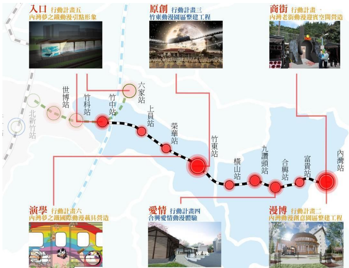
硬體行動構想內容圖

以六家高鐵站及竹中轉運站為主口，以內灣老火車為載具，打造夢之鐵動漫氛圍迎接國際旅人進入竹東核心動漫園區、感受合興站愛情故事，穿過櫻花林道，進到內灣動漫園區造訪內灣老街及劉興欽漫畫發明館、漫畫主題公園展演空間。