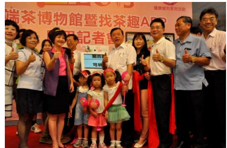
102/6/24 雲端茶博物館暨找茶趣 APP 啟用記者會

資料最完整、全國首支可自行規劃找茶遊程的 APP，根據縣內 337 家業者進行分類，民眾透過地圖可清楚查詢附近店家資訊、查詢 10 個茶席示範點、5 條「找茶路線」位置，讓民眾自行規劃竹縣茶之旅。