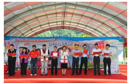
102/6/25 部落警政嘉年華活動

102年6月24日於五峰鄉舉辦「愛與關懷」部落警政嘉年華活動，由新竹地檢署緩起訴處分金支應，本縣配合以園遊會互動闖關方式辦理，讓學童與民眾更能了解到相關的法令資訊。