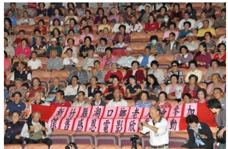
100/11/7 樂齡電影節 邀請長者看懷舊電影

為讓縣內老人活的健康、活的快樂，參與團隊活動擴大人際交流，從 100 年開始舉辦社區樂齡電影節，101 年起電影節更深入各個鄉鎮，讓長輩可以就近參與相約看電影。