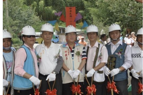
102/7/31 玉峰大橋開工典禮

1) 說明：玉峰大橋為石磊道路跨越玉峰溪的過水橋樑，因橋墩鋼筋斷裂裸露，危及用路人生命財產安全，獲原民會補助進行新建橋樑經費 1 億 4 百萬元。