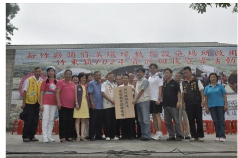
102/7/21 頭前溪環境教育設施場所啟用

「新竹縣竹東頭前溪水質生態治理區1、2期」102年6月通過認證，取得環境教育設施場所資格，成為新竹縣第2也是公家單位第1個環境教育認證場所。