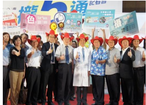
102/6/26 交通部觀光局「台灣好行攏5通」獅山線 go 好玩 好康優惠記者會

台灣好行獅山線於99年7月啟動免費接駁，自101年起開始收費，仍持續受到鄉親及國內外旅客肯定，為擴大推廣獅山線旅遊，延長旅客停留時間，今年推出親子套票及自由行套裝行程優惠，結合周邊景點及休閒旅遊業者、商圈店家、社區等，提供超值豐富的行程供大眾選擇，另外民眾也可利用本縣的快捷6號免費公車由竹東轉乘至內灣老街。