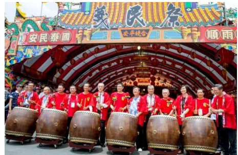
102/8/17 義民祭副總統親自到場擔任主祭