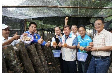
102/9/23 縣長視察金線蓮與段木香菇

本府及五峰鄉公所於去(101)年12月在五峰和平部落休閒農業區輔導成立「五峰鄉菇類產銷班第1班」，目前有14位班員，每年栽種30,000瓶，段木香菇年產量約80,000