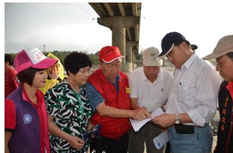
中正大橋接連因7、8月颱風受重創