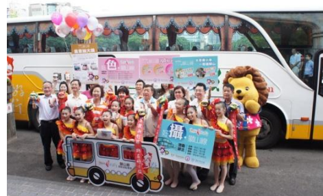
102/7/10 獅山線 go 好玩 好康優惠記者會

2) 3款自由行套票遊程：「獅山 GO 好玩」、「山城懷舊趣」、「來去住一晚」（尖石）