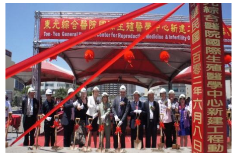
102/6/8 東元國際生殖醫學中心動工

繼 101 年 12 月東元醫院與美國史丹佛大學生殖醫學中心簽訂技術合作備忘錄的國際醫療合作案後，今年（102 年）6 月東元醫院以國際級的標準在高鐵地區動工興建『國際生殖醫學中心』 4 ，緊接著 7 月再度宣布與全球最大卵子銀行 My Egg Bank 公司互簽技術合作備忘錄，可預見新竹地區的生殖醫學技術與醫療品質在國際醫療團隊的合作下將大幅提升。