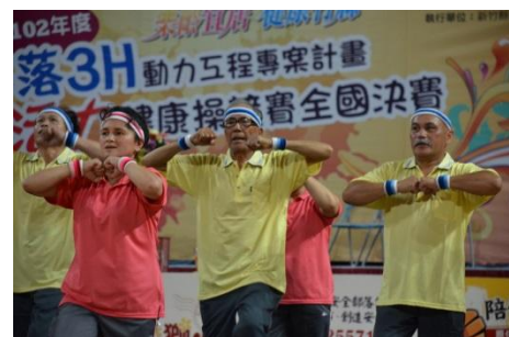
102/5/27 梅嘎浪總體產業發展協會獲亞軍

全國部落 3H 動力工程專案計畫活力健康操競賽，今年 5 月在新竹縣體育館進行決賽，尖石鄉梅嘎浪總體產業發展協會代