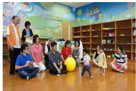
102/6/17 新竹縣托育資源中心揭幕

新竹縣托育資源中心於102年6月17日於新竹縣婦幼館(竹北)揭牌，主要服務對象為0至3歲嬰幼兒之家庭，提供嬰幼兒托育協助，落實「建構完善育兒體系，營造樂婚願生環境」的施政目標。