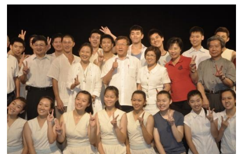
102/7/17 縣府團隊與「優人神鼓」簽訂合作意願書