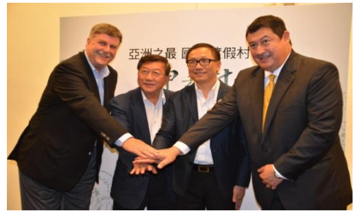
102/6/25 GHM 集團宣布神去村計畫

看好本縣山海湖風光與友善投資環境，知名休閒度假旅館集團 GHM(General Hotel Management)，規劃投資 70 億與圓方創新公司聯手在竹東五指山興建北台灣最大渡假村—神去村，受到各方矚目。