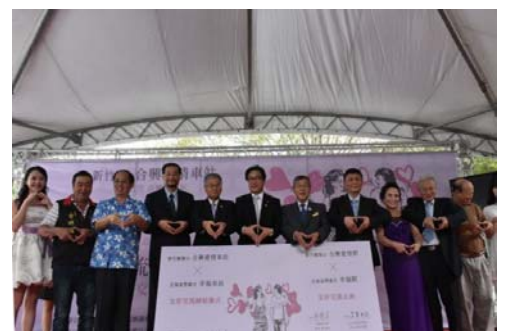
105/10/22日本幸福車站與本縣合興車站簽署合作備忘錄

日本北海道帶廣市幸福車站與本縣橫山鄉合興車站於105年10月22日簽署鐵道產業文化合作備忘錄，締結成姐妹站