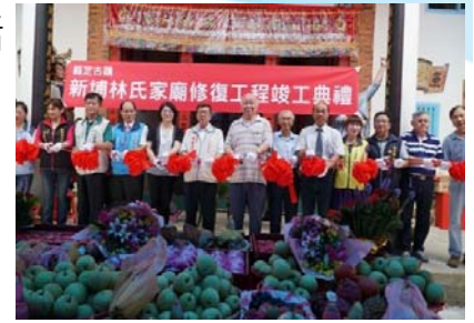
105/7/10 林氏家廟修復工程竣工典禮