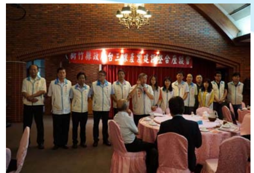
105/9/12 台三線產業建設整合座談會