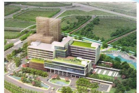
生醫園區醫院總體規劃鳥瞰圖