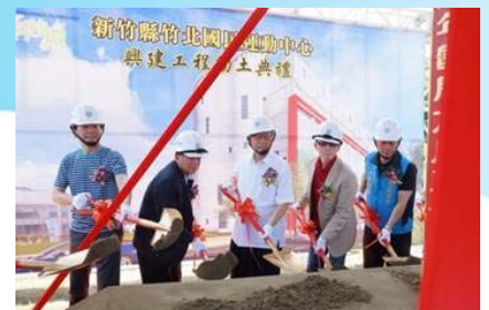
105/6/25 新竹縣竹北國民運動中心興建工程動土典禮