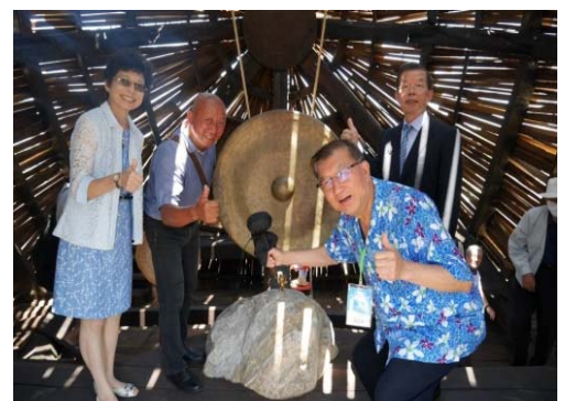
105/7/18 日本瀨戶內國際藝術祭