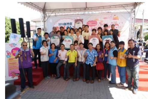
105/10/15 國際動漫藝術節登場