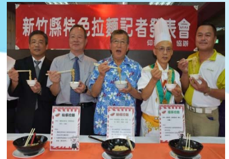
105/7/29 新竹縣特色拉麵記者發表會