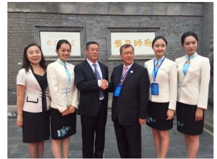
105/9/22 海峽兩岸交流基地授牌儀式暨第七屆兩岸三館年會開幕式