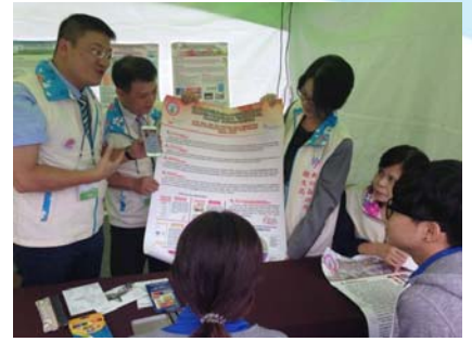
105/8/29 參加WHO第七屆西太平洋健康城市聯盟全球大會