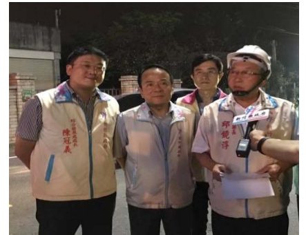
105/10/26 勘查水銀路燈落日計畫辦理情形

105年度至9月底止50米以上工程已執行8,972公尺(15件)，50米以下零星搶修工程已執行1,413件