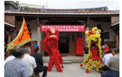
105/9/2 北埔忠恕堂修復工程竣工暨金廣福文教基金會揭牌典禮