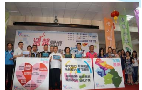
105/10/20 新竹縣在地行動服務成果發表會