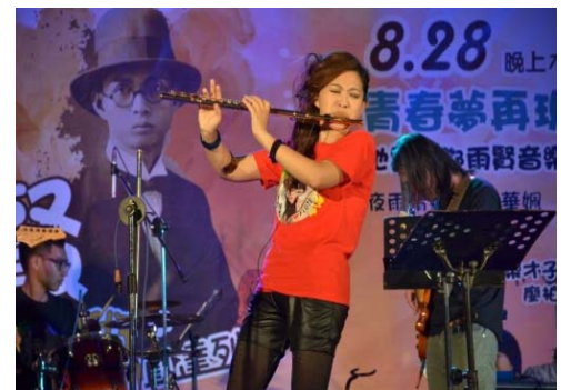
105/8/28 青春夢再現·復古音樂趴