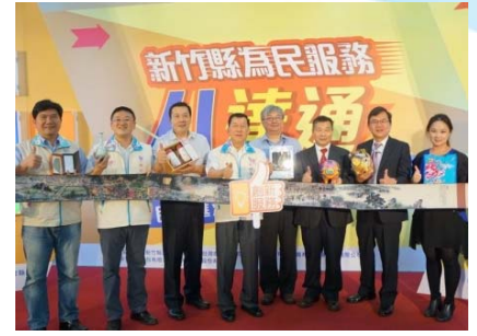
105/6/6 新竹縣為民服務暨八達通 啟動記者會