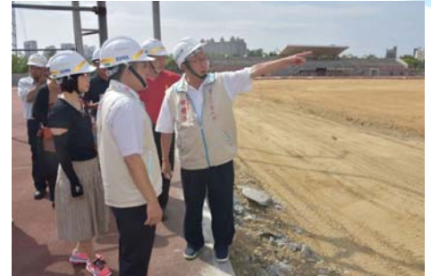
105/10/21 縣府團隊視察本縣第二運動場之足球場興(修)建工程