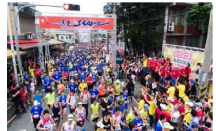
105/8/13 義起愛運動勇士路跑