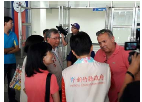
105/10/23 2017台北世界大學運動會FISU技術代表團檢視會勘