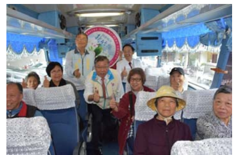
105/5/18 關西-橫山愛心醫療專車啟動