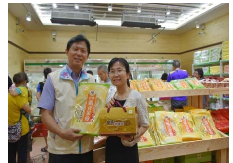
105/9/8 竹北市農會六家農民直銷站開幕