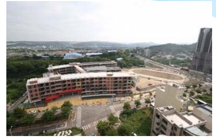
105/9/1 安興國小新建校舍空拍照