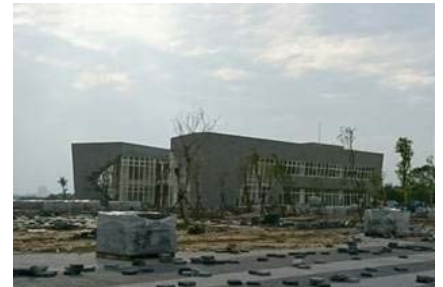
台科大竹北分部前瞻研發中心暨基礎公共設施及景觀工程(第一期)