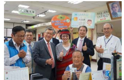
105/10/11 五峰鄉公所啟動健保卡在地 製卡現場領卡服務