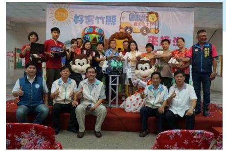
105/7/7 2016好客新竹來趣淘記者會