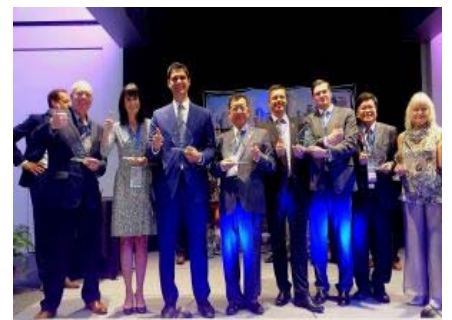
105/6/17國際智慧城市論壇(ICF)高峰會

獲經濟部工業局第14屆「金企鵝」健康類最佳應用獎 獲WHO第七屆西太平洋健康城市聯盟全球大會列為創新及智慧城市典範