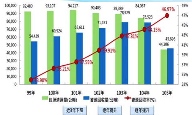
資源回收量歷年比較表

資源回收率提昇為46.97%，較104年同期增加3.43%，整體垃圾回收率為54.56%