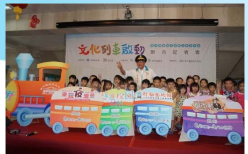
105/8/25 文化列車啟動記者會

結合「自行車嘉年華」及「新竹縣客家童玩嘉年華」，以創意、活潑與歡樂的方式進行，推動自行車活動及跨域國際觀光旅遊