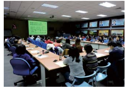
106/1/17 一例一休勞動基準法修法說明會