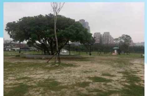
婦幼館旁國際環境教育園區預定地