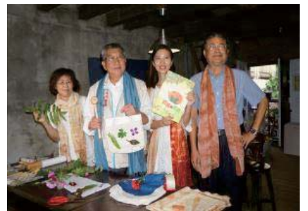
105/11/15 關西鎮文創商店經營有聲有色