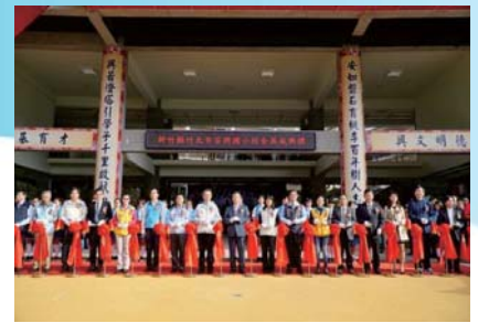
105/12/3 安興國小一期工程落成典禮暨親子運動大會

教育部核定106-108年補助經費，共計11億1,062萬257元，改善國民中小學校舍老舊及耐震能力不足問題