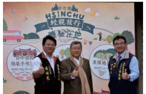
105/12/1 宣傳竹縣一日體驗生活輕親旅行