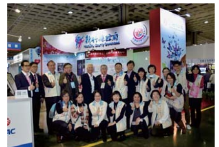
應邀參加「2017智慧城市展」 展示7項智慧城市成果