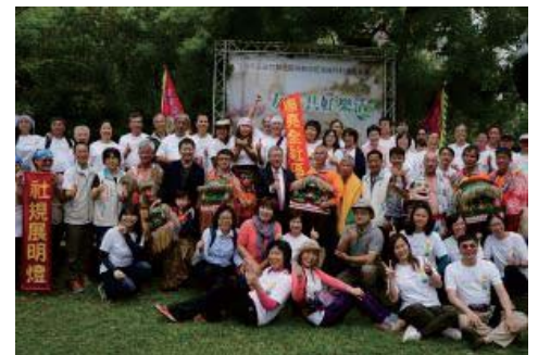
106/4/15 105年度社區規劃師駐地操作計畫 戶外動態成果展