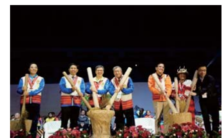
106/3/25 106年全國原住民族運動會 開幕典禮