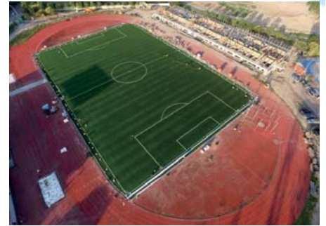
世大運足球場人工草皮取得 國際足球總會(FIFA)最高等級2顆星認證