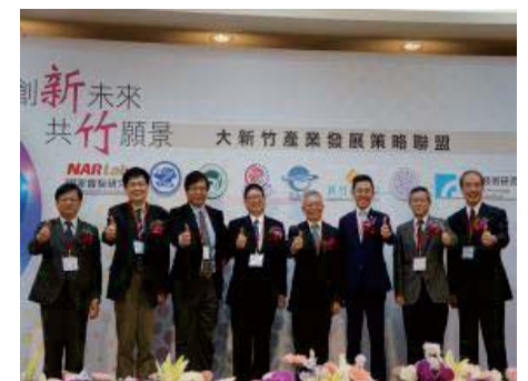
106/4/10 共同簽署「大新竹 產業發展策略聯盟合作備忘錄」