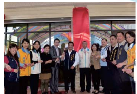
105/12/19 新竹縣湖口鄉ABC社區整體照顧服務中心暨長照標章掛牌