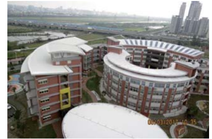
105/12/27 興隆國小二期工程完工