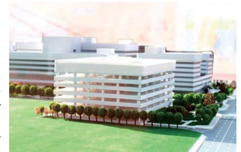
中國醫藥大學新竹縣健康產業園區 規劃鳥瞰圖