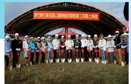
105/11/11 竹東河濱公園棒壘球場 開工動土典禮