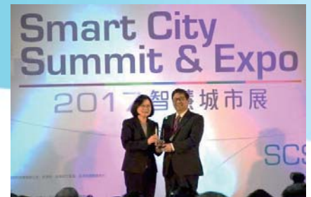
106/2/21 獲頒「2017年智慧城市創新應用獎」

即時公車動態手機APP系統提供民眾新竹縣、市各類公車資訊，截至106年3月下載次數約3萬人次