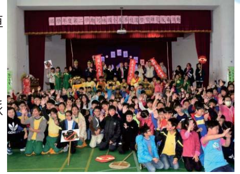
106/2/15 芎林國小友善校園 暨紫錐花反毒活動