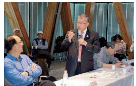
105/12/21 向文化部極力爭取竹北六家水圳文化景觀再現計畫經費

預計 106 年 5 月 31 日前，完成文史調查研究成果報告書，107年完成編纂作業