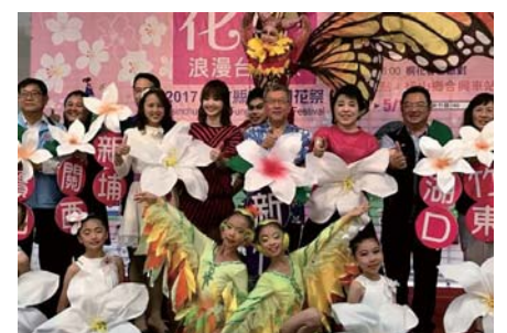
106/4/17 2017新竹縣客家桐花祭記者會