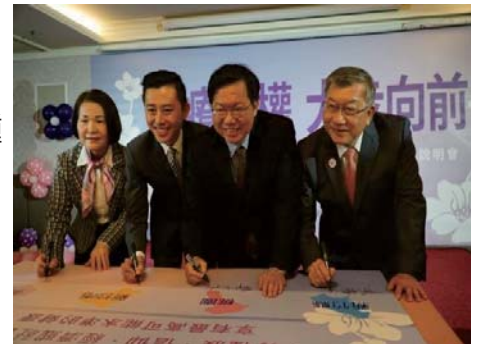
106/1/3 透過桃竹竹苗區域治理平台 爭取醫療平權