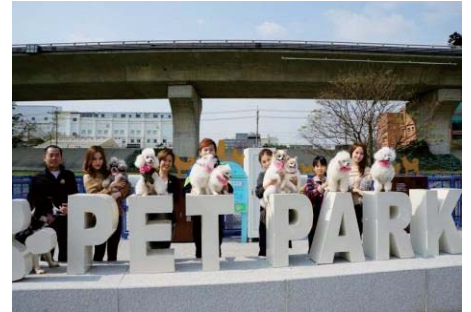
106/3/4 寵物運動公園正式啟用