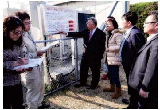
106/2/26 率團訪日取經，充實污水處理實務