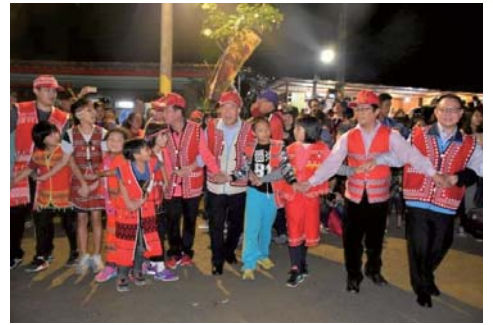
105/11/12 寶夏族矮靈祭十年大祭