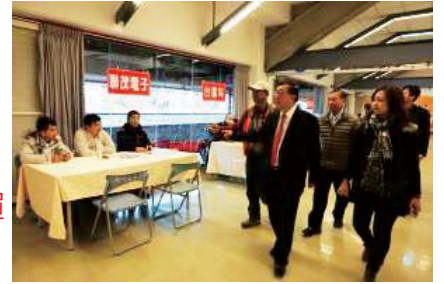
向設攤企業問候—2017「用心裁職·培育薪契機」大型徵才活動