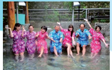
105/12/28 行銷2017新竹縣觀光美食溫泉季