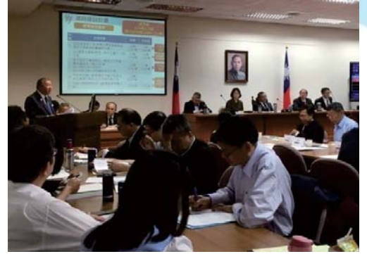
106/4/19 出席立法院 「前瞻基礎建設特別條例草案」公聽會