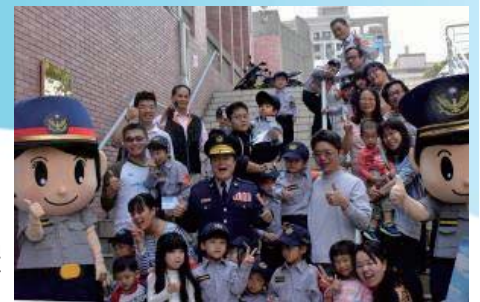
106/4/8 首屆一日小小警察萌闖體驗營