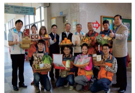
106年起，於縣府辦理「青農小市集」