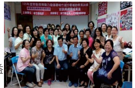
失業者技能訓練班結訓典禮