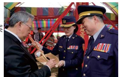
106/4/15 新埔照門派出所 開工動土典禮

成立專案小組，106年3月20日與新竹地檢署發動聯合稽查，俟確認違建地點及範圍後，將全面拆除