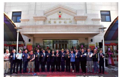
106/3/27 新埔分局關西分駐所落成啟用

總經費2,600萬元，106年3月29日完成規劃設計監造案招標，預計106年7月辦理工程招標，107年6月完工