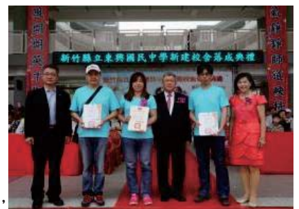
106/4/15 東興國中一期工程落成典禮