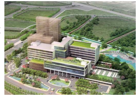
新竹生醫園區醫院總體規劃鳥瞰圖