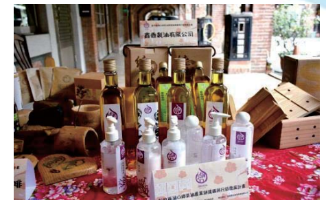
湖口茶油產業鏈建構行銷發展計畫 建構茶油安心品牌