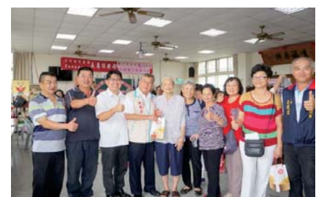
105/10/8 竹東鎮樂齡學習中心員山學堂揭牌