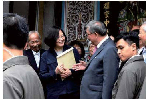
106/4/22 蔡總統參訪本縣陳氏宗祠時，陳交本縣28項前瞻基礎建設計畫報告