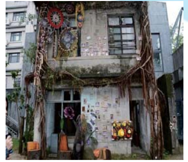
106/3/6 竹東動漫園區駐村藝術家作品－「老樹屋藝想」