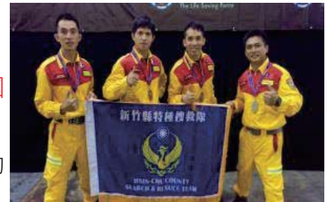
獲新加坡國際消防與救護挑戰賽殊榮