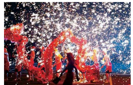
106/2/12 新埔花燈迎天穿 中國重慶市銅梁火龍隊表演