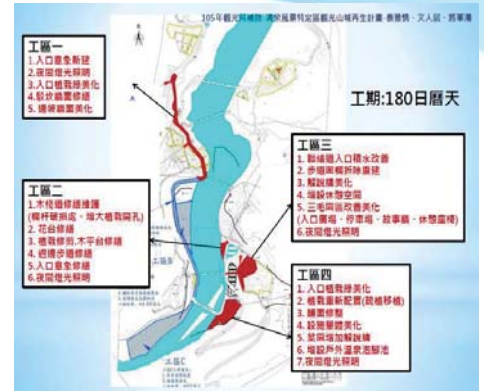
清泉風景特定區觀光山城再生計畫 四工區施作計畫圖