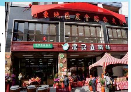
106/1/18 竹東地區農會 農民直銷站開幕