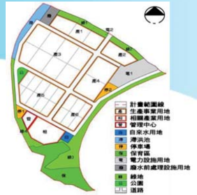
鳳山工業區開發案

105年由國防部軍備局辦理變更非公用作業，106年1月改由財政部國有財產署接管，106年4月繳清土地價款，刻正辦理43筆土地所有權移轉，並獲同意先行進場施作地質鑽探工程，區內相關公共工程預計106年6月動工，108年12月營運