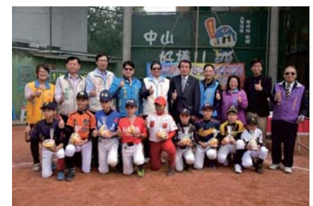
106/1/19 2017新竹縣中日少棒 國際交流賽