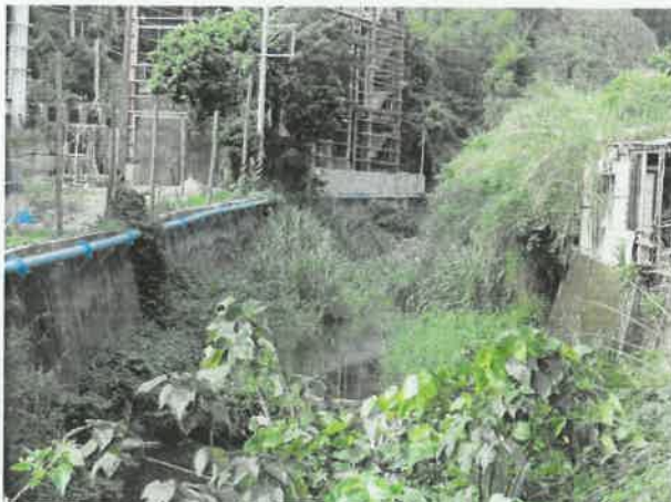
芎林鄉華龍村鹿寮坑溪封溪護漁範圍迄點(B)