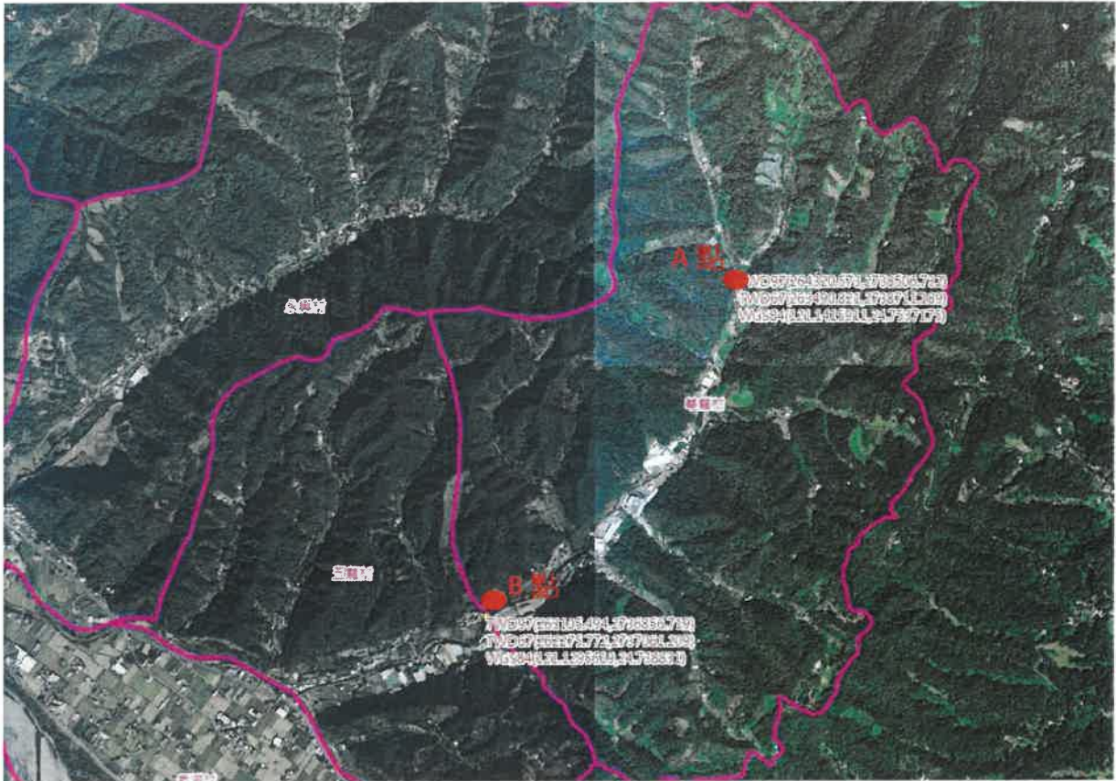
芎林鄉華龍村鹿寮坑溪封溪護漁範圍起始點(A)