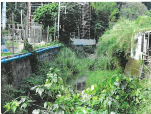
芎林鄉華龍村鹿寮坑溪封溪護漁範圍迄點(B)