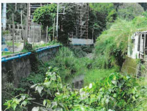
芎林鄉華龍村鹿寮坑溪封溪護漁範圍迄點(B)