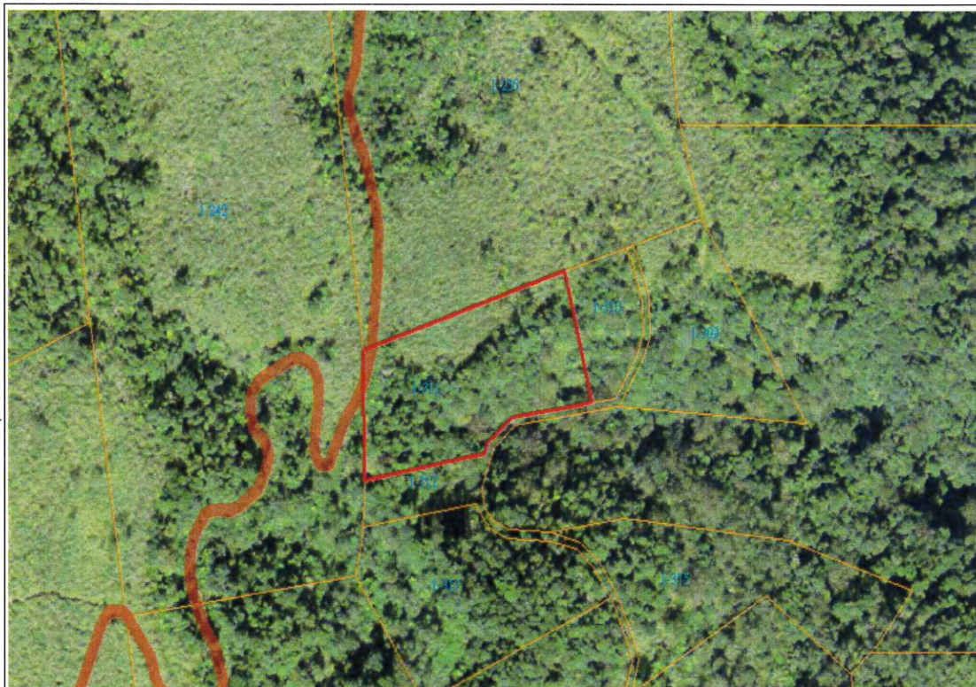
仲岳段 1-311 地號