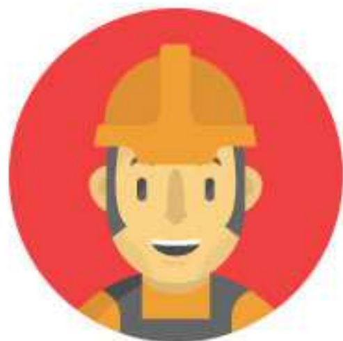
戶外工作者/運動員