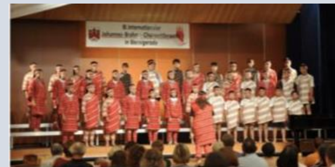
泰雅學堂： 享譽國際的尖石在地表演團體。