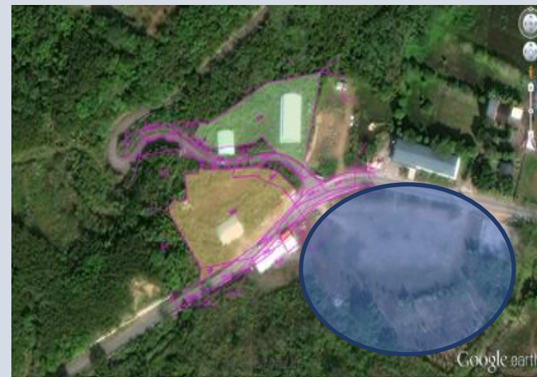
中程規劃設置“klapay”假日市集廣場之地理位置圖