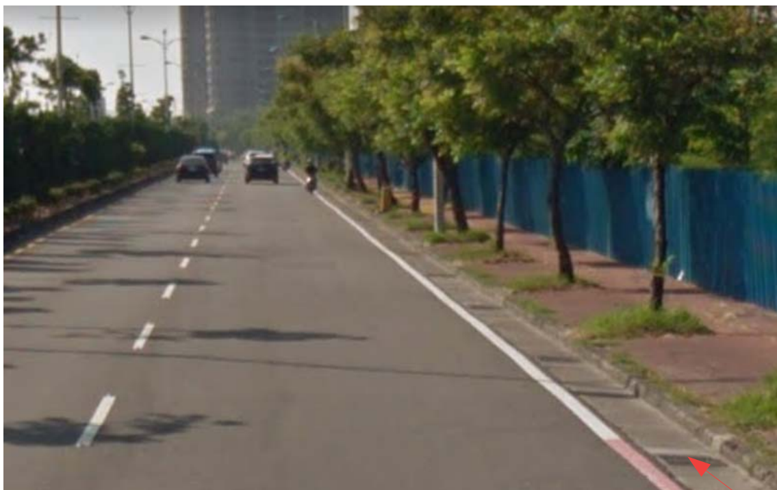
標註申請日期前三日內的拍攝日期