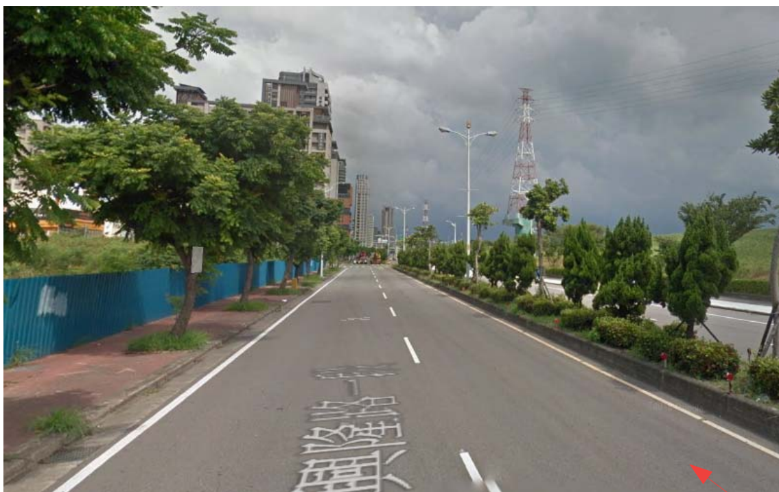
標註申請日期前三日內的拍攝日期