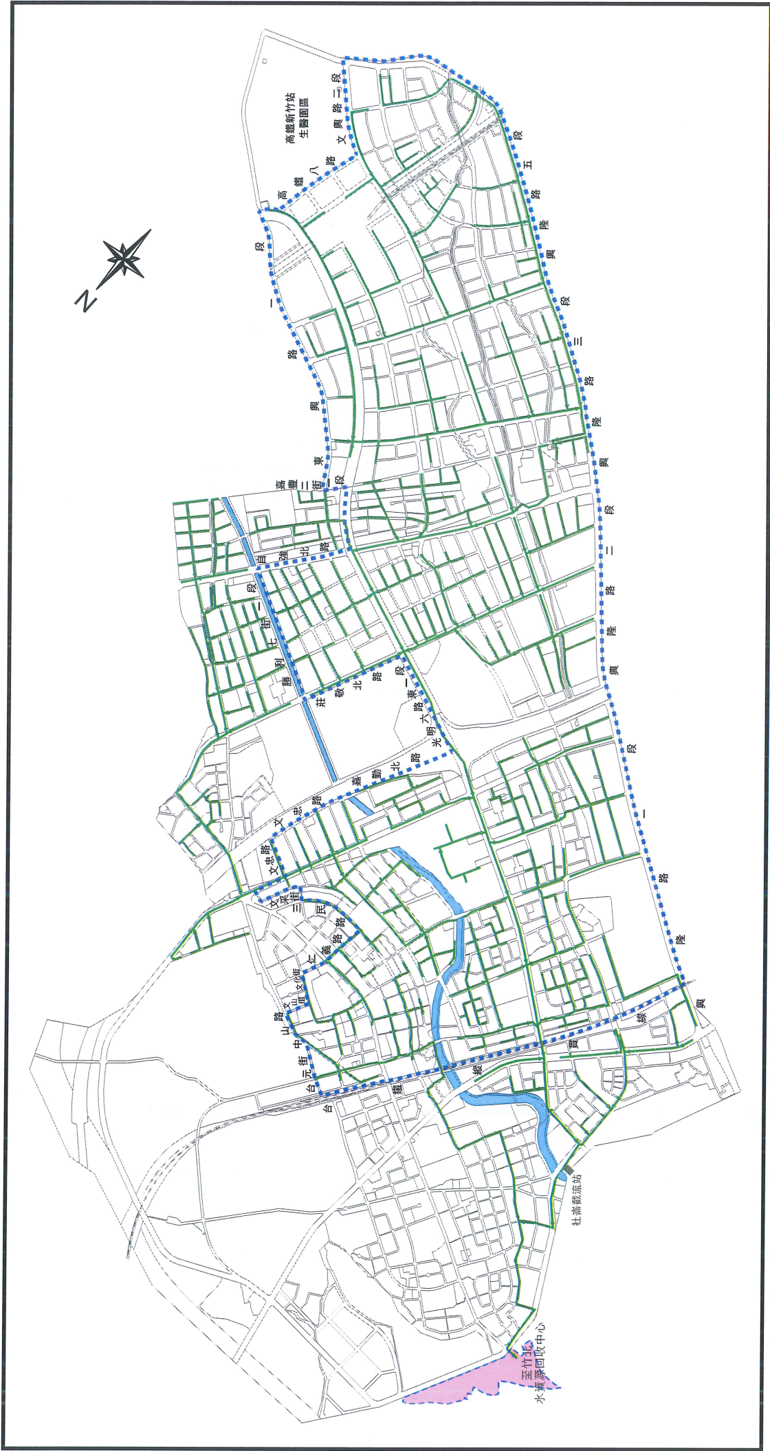
竹北市公共污水下水道系統可用地區(中正重劃區)公告(第三階段, 113年1月)