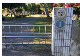
側門增設無障礙服務鈴