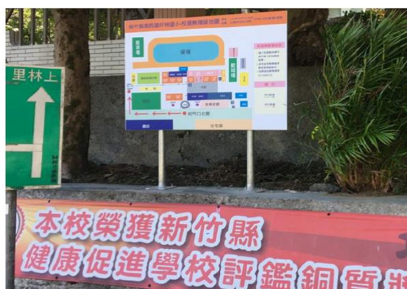
改善後 學校大口引導