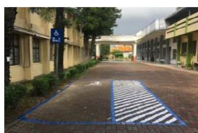
原無障礙停車位(配合引導標示,重新繪製)