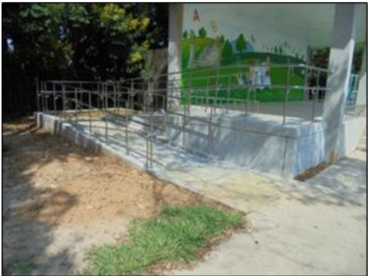
九、這一鍋餐飲股份有限公司同話竹北光明分公司-活動式