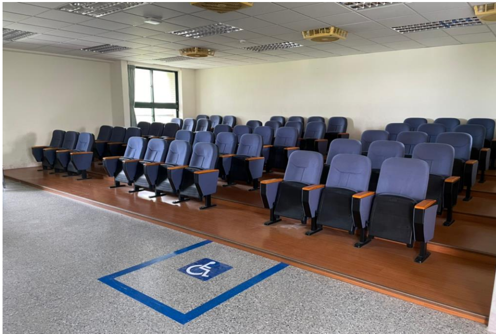
八、新竹縣竹東鎮員峽國民小學-升旗台/無障礙坡道