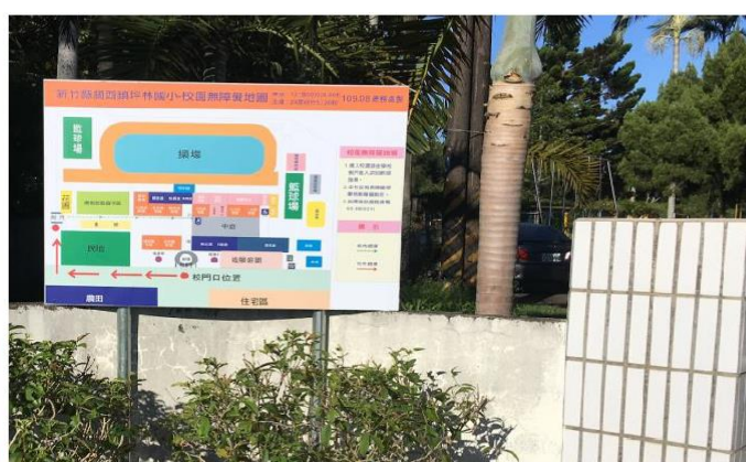
學校側門(車輛進出口)