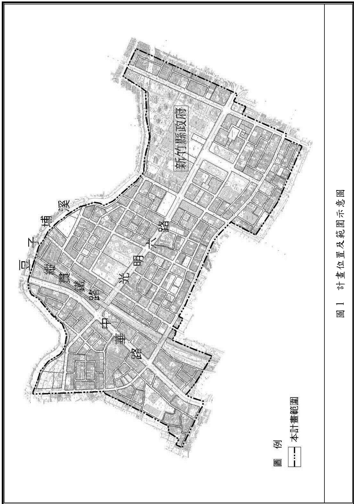
圖 1 計畫位置及範圍示意圖