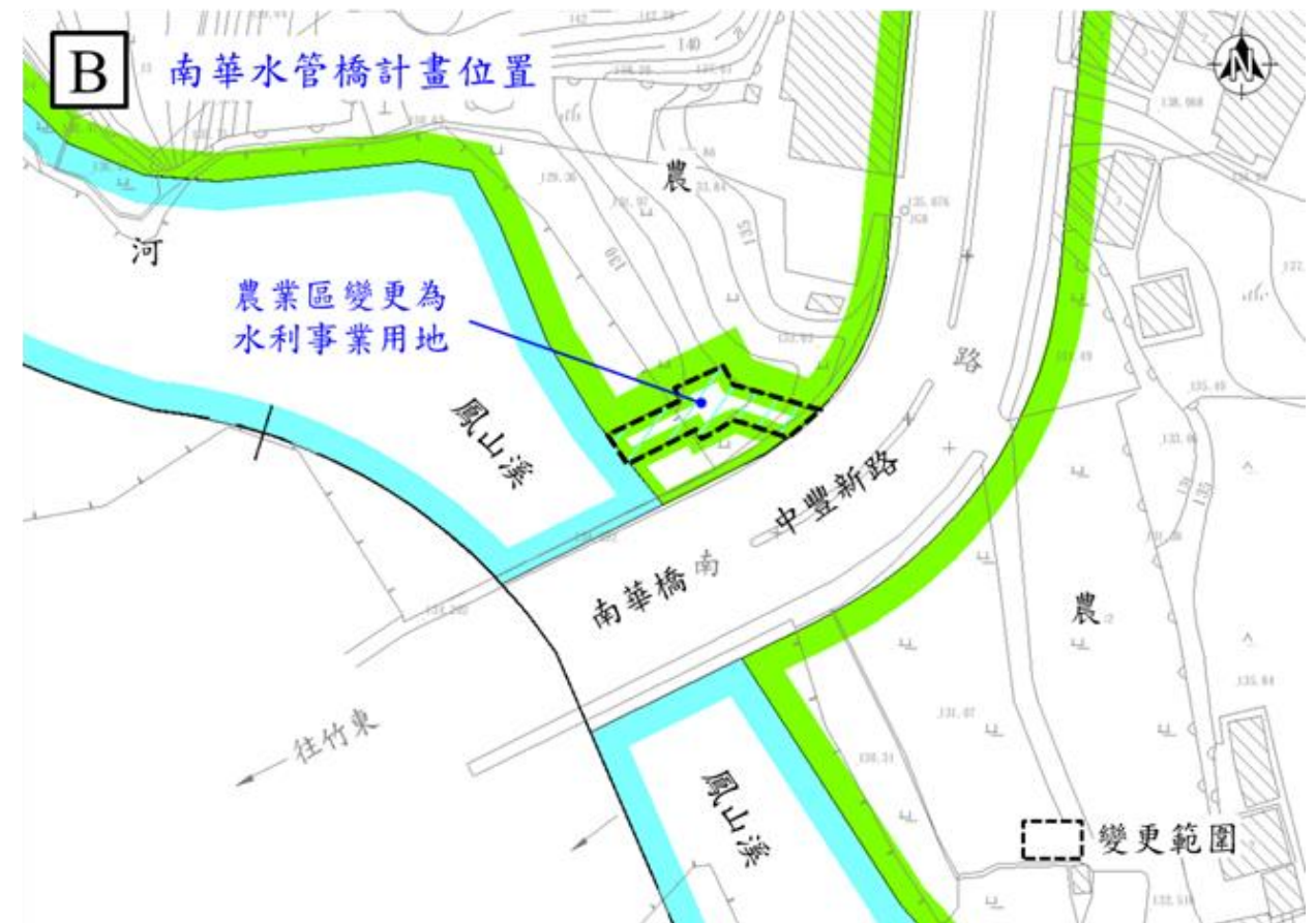
「變更關西都市計畫(配合石門水庫至新竹聯通管工程)」案變更內容示意圖