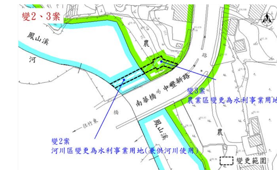
「變更關西都市計畫(配合石門水庫至新竹聯通管工程)」案變更內容示意圖