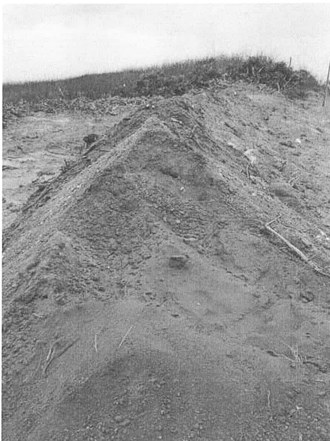
澎湖縣西嶼鄉橫礁新段 378 地號土地現況照片