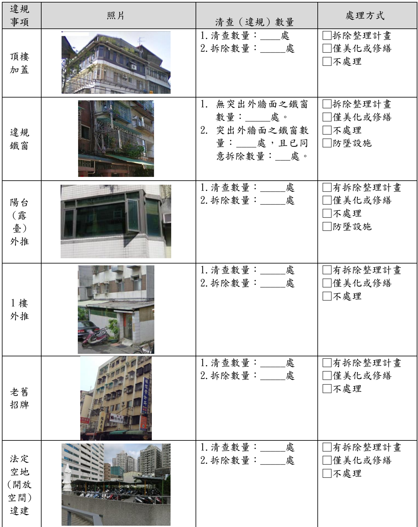
表 3-1 違建及違規物分析表