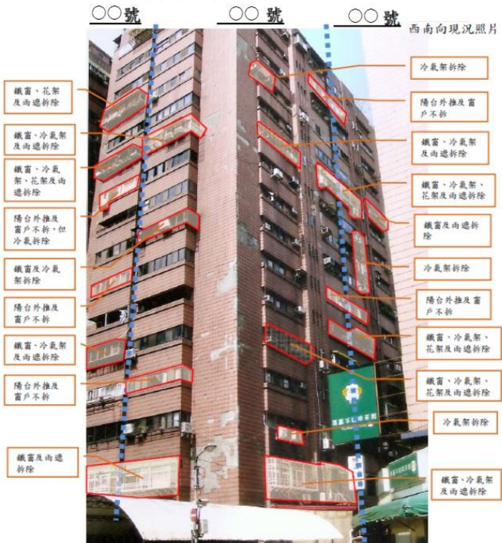
圖 3-1 違建及違規物拆除意願結果分析圖