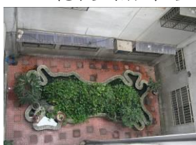
中庭水池易生病媒蚊