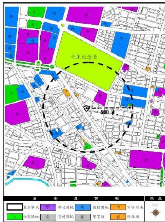
周邊公共設施及觀光景點分布圖

八、基地範圍半徑五百公尺內土地使用現況/交通系統現況/公共設施現況/觀光景點等地區發展狀況說明（請以文字說明並於圖面標明）：