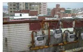
屋頂瓦斯表及管線